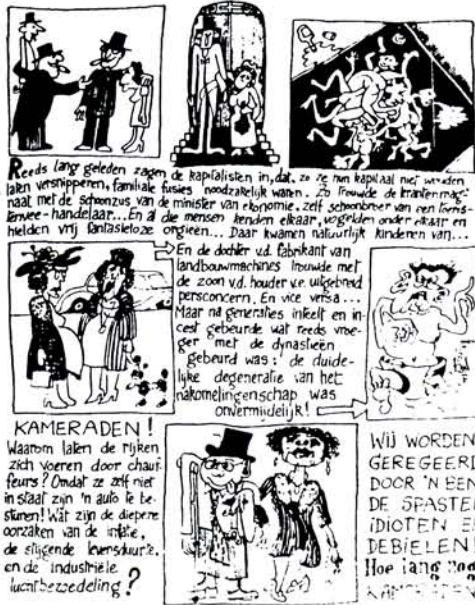
Situationisme : remedie tegen een verkalkt socialisme

WE BEZIT DE MACHT ? De kapitalisten! juist! MAAR: wie zijn zij