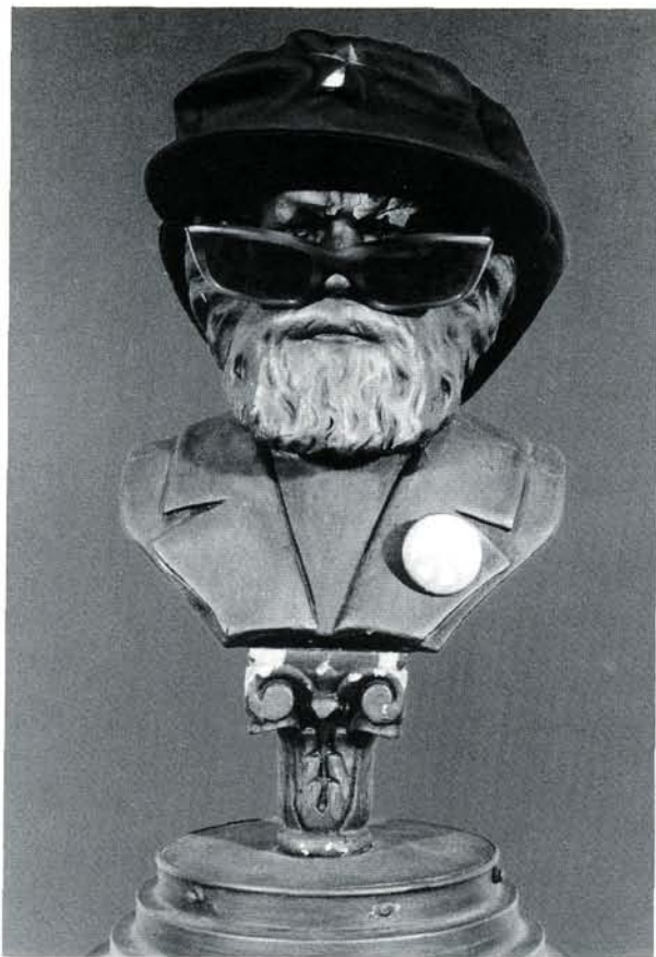
Cours, camarade, le vieux monde est derrière toi.