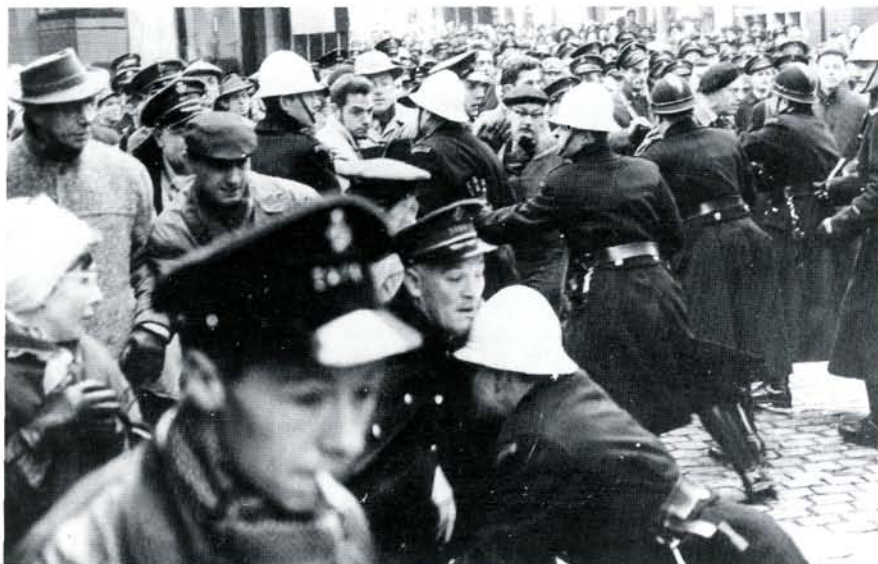
Brussel, omgeving Grote Markt op 5.1.1961

schrijven van het referendum op volksinitiatief in de grondwet. Naar Brussel toe vroeg men onder meer een engagement voor het bijeenroepen van een Brusselse assemblée, het bevorderen van de Franse cultuur, het verdedigen van de vrije keuze van het gezinshoofd voor de onderwijstaal van zijn kinderen te Brussel en van de externe tweetaligheid in de gemeentelijke diensten uit het Brusselse. In Brussel werden deze eisen onderschreven door alle K.P.-lijsten, de Etterbeekse Union Démocratique et Francophone, heel wat liberale en enkele christendemocratische en socialistische kandidaten.