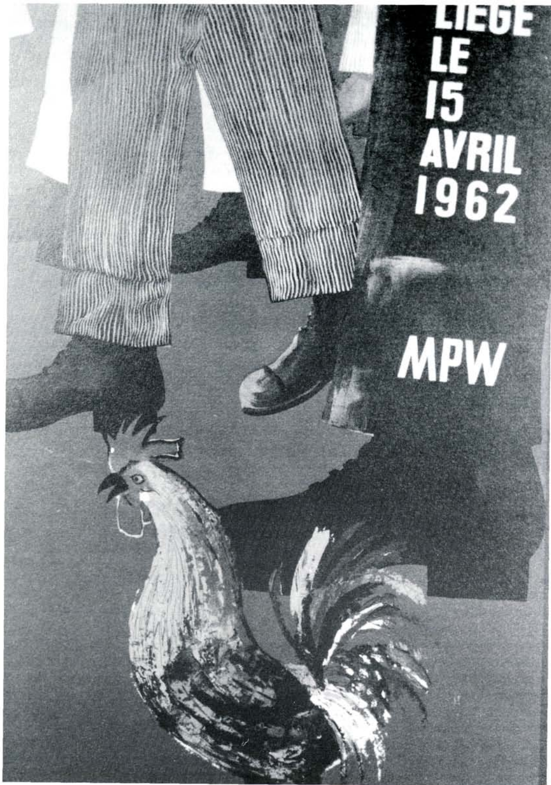
De oprichting van de Mouvement Populaire Wallon (MPW) gaf nieuwe impulsen aan het Waals federalisme