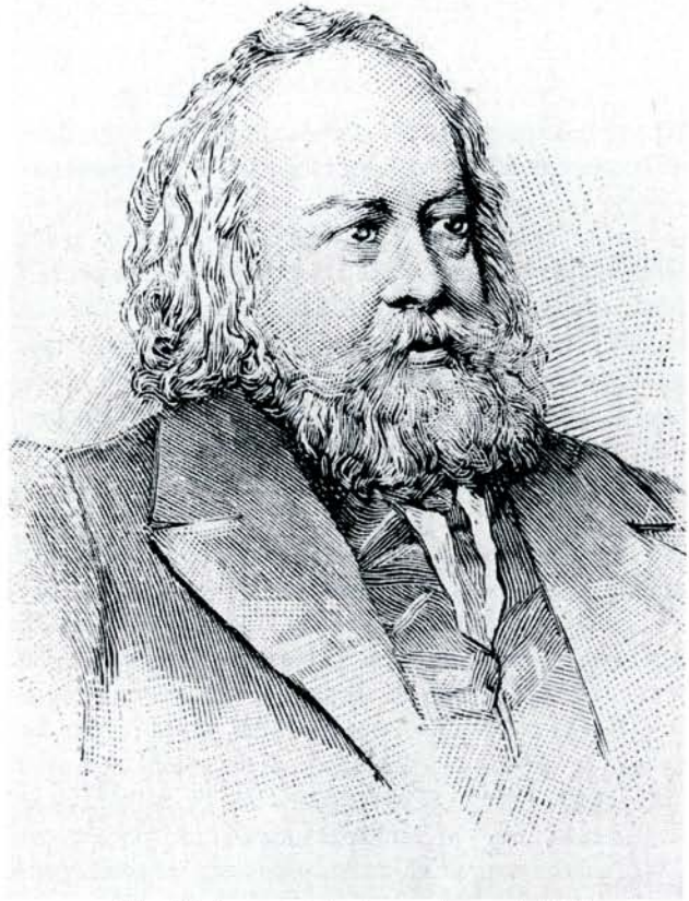
"De drift der vernietiging is een scheppende drift" Bakoenin (1814-1876)

Op een georganiseerde wijze ingrijpen in het revolutionaire proces lag wellicht nooit in de bedoeling van de Belgische anarchisten. Enige nuancering van wat vaak als een wezenlijk kenmerk van het anarchisme wordt gezien, met name zijn voluntaristische opvatting van de revolutie,