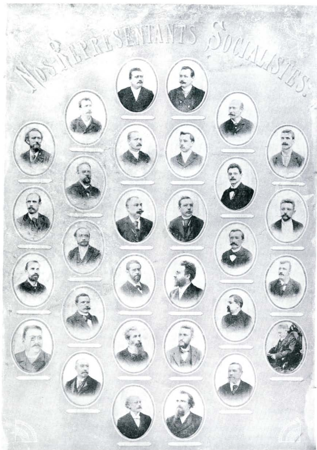
De socialistische Kamerfractie, 1894