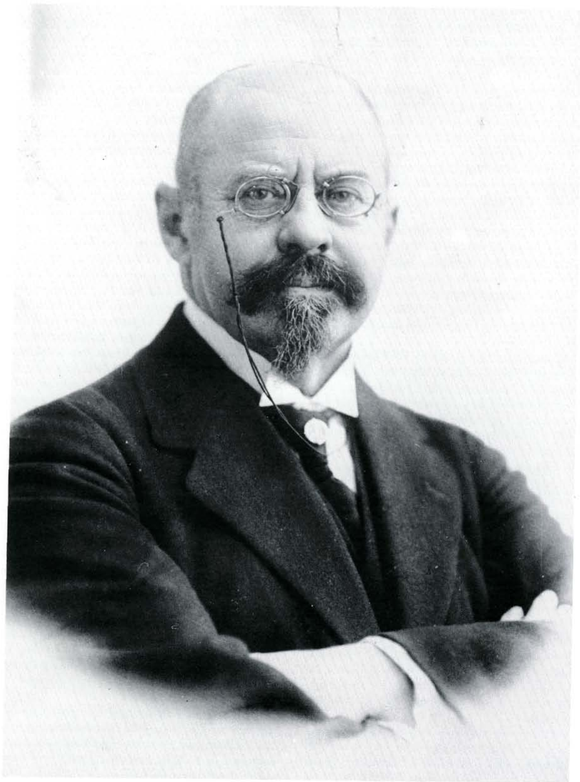
De "sociaal-patriot" Emile Vandervelde, boeman van de bolsjevieken.