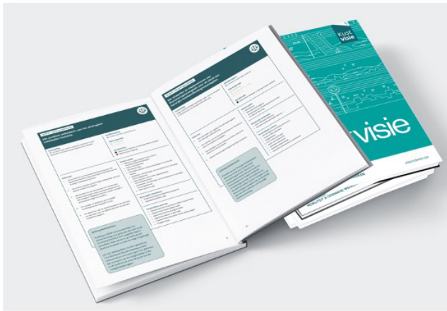
Figuur 3: actieplan - Bijlage van het ontwerp strategisch beleidsplan.

denken in fases aan de orde. De werkbankleden werden betrokken voor inhoudelijke en kwalitatieve discussie ter voorbereiding van het ontwerp strategisch beleidsplan. De actiehouders of co-auteurs werden betrokken in het zetten van een agenda voor toekomstige beleidscycli. Je wil de juiste mensen op het juiste moment rond tafel. De vuistregel: wacht niet te lang, anders vergroot de kans op een georganiseerde tegenstand (in de vorm van burgerbewegingen, protestacties, maar ook parlementaire vragen, politieke recuperatie in campagnes, enzovoort). De tegenstand bepaalt dan de toon van het debat en dat maakt verzoening tussen verschillende belangen vaak moeilijker.