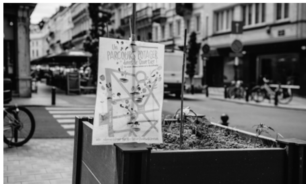
Un parcours potager dans le quartier!" - Een bottom-up stadslandbouwproject in Brussel.

Professionele zorg mag niet op de achtergrond verdwijnen, maar moet informele zorg omkaderen en ondersteunen. Zorgzame buurten zijn meer dan zorgzame bureaus, en kunnen geen oplossing zijn voor een gebrek aan toegankelijke, professionele zorg. Informele hulp kent immers haar grenzen. De verwachtingen tegenover informele zorgverleners mogen niet te hoog worden. Veel mantelzorgers en vrijwilligers bezwijken onder de zware last op hun schouders. De kwaliteit van de zorg kan in het gedrang