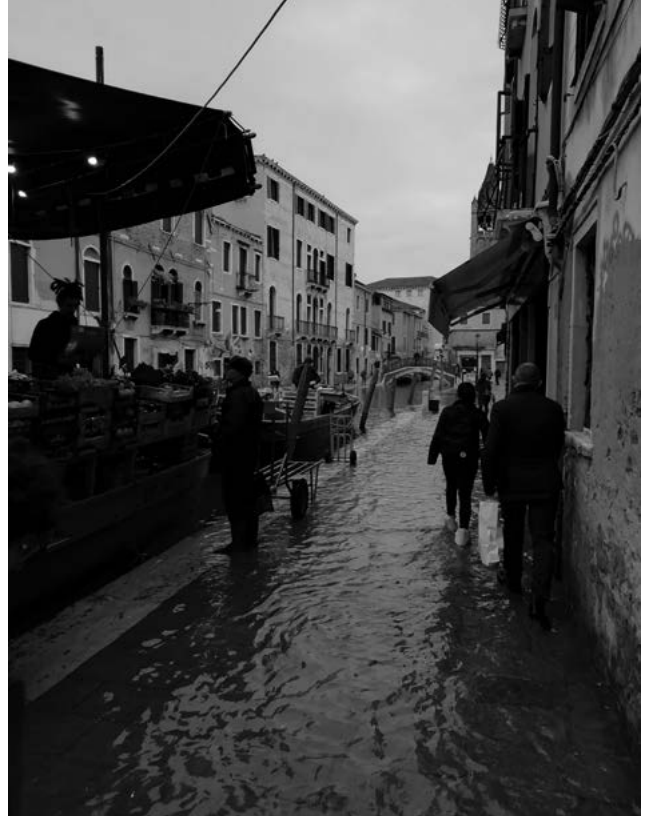
Dit jaar in ieder geval geen natte voeten...

Virtueel toerisme lijkt vooral ingezet te kunnen worden als voorbereiding op een reis, en is daarmee wellicht ook een interessante marketingtool voor een toeristische bestemming. Hiervoor lijkt er vooral meer onderzoek nodig te zijn naar de mening van toeristen over een bestemming na een virtueel (voorbereidend) bezoek en hoe dit het best kan worden vormgegeven. Dat geldt ook voor hoe virtueel toerisme kan bijdragen aan een meer duurzame toeristische ontwikkeling. Wat is bijvoorbeeld de rol van virtueel toerisme in de spreiding van toeristen? Uit onze beperkte vragenlijst kwam naar voren dat een virtueel bezoek niet betekent dat men de meest bezochte of kwetsbare highlights links laat liggen, laat staan