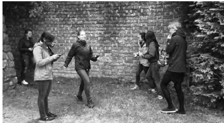
Studenten verrichten onderzoek bij de Muur.

In 2018, vrijwel direct na de uitslag van de prijsvraag, kwam het doorslaggevende oordeel van minister van Engelshoven (OCW) die besloot tot aanwijzing tot rijksmonument. Zij zei daarbij: "Erfgoed zoals deze muur confronteert ons met de zwarte bladzijden in onze geschiedenis. Het dwingt ons die bladzijden te lezen en te herlezen,