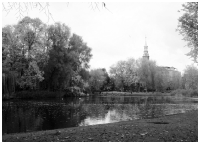
Het Oosterpark in Amsterdam.

Een voorstel om het Oosterpark 's nachts af te sluiten om de overlast van alcoholisten in het park tegen te gaan stuitte namelijk op protest van een andere groep: mannelijke cruisers die de bossages 's nachts