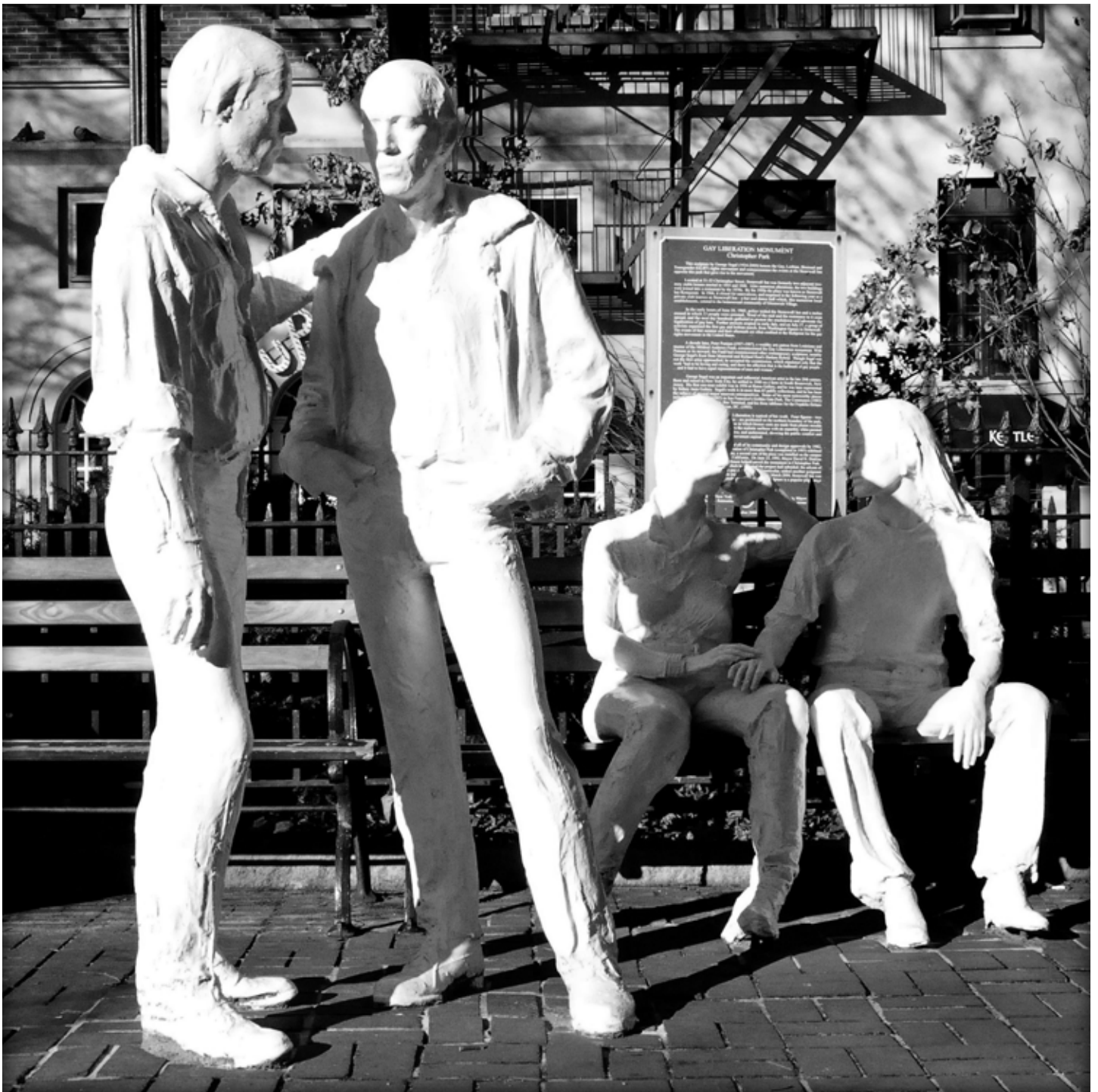
"To love and be loved", Gay Liberation monument in New York City.

grenzen van het tolereerbare' blijven. Deze grenzen worden in stand gehouden op basis van de heteroseksuele versie van de publieke/private scheiding. Seksueel burgerschap loopt zo uit op een disciplinerende uitgetekende op basis van heteronormatieve krijtlijnen. Homoseksuelen worden getolereerd in de mate dat ze conformeren aan de heteroseksuele normen wat betreft relatievorming en seksualiteit. Homoseks kan, maar binnen een stabiele relatie, en niet (teveel) in het publiek. De discussie over het homohuwelijk is hiervan een mooi voorbeeld. In 1995 argumenteerde Andrew Sullivan in 'Virtually Normal' dat de legalisering van het homohuwelijk een belangrijke stap vooruit kon betekenen in de emancipatie van homoseksuelen. Het zou immers de weg effenen voor een inclusie van homoseksuelen in de samenle-