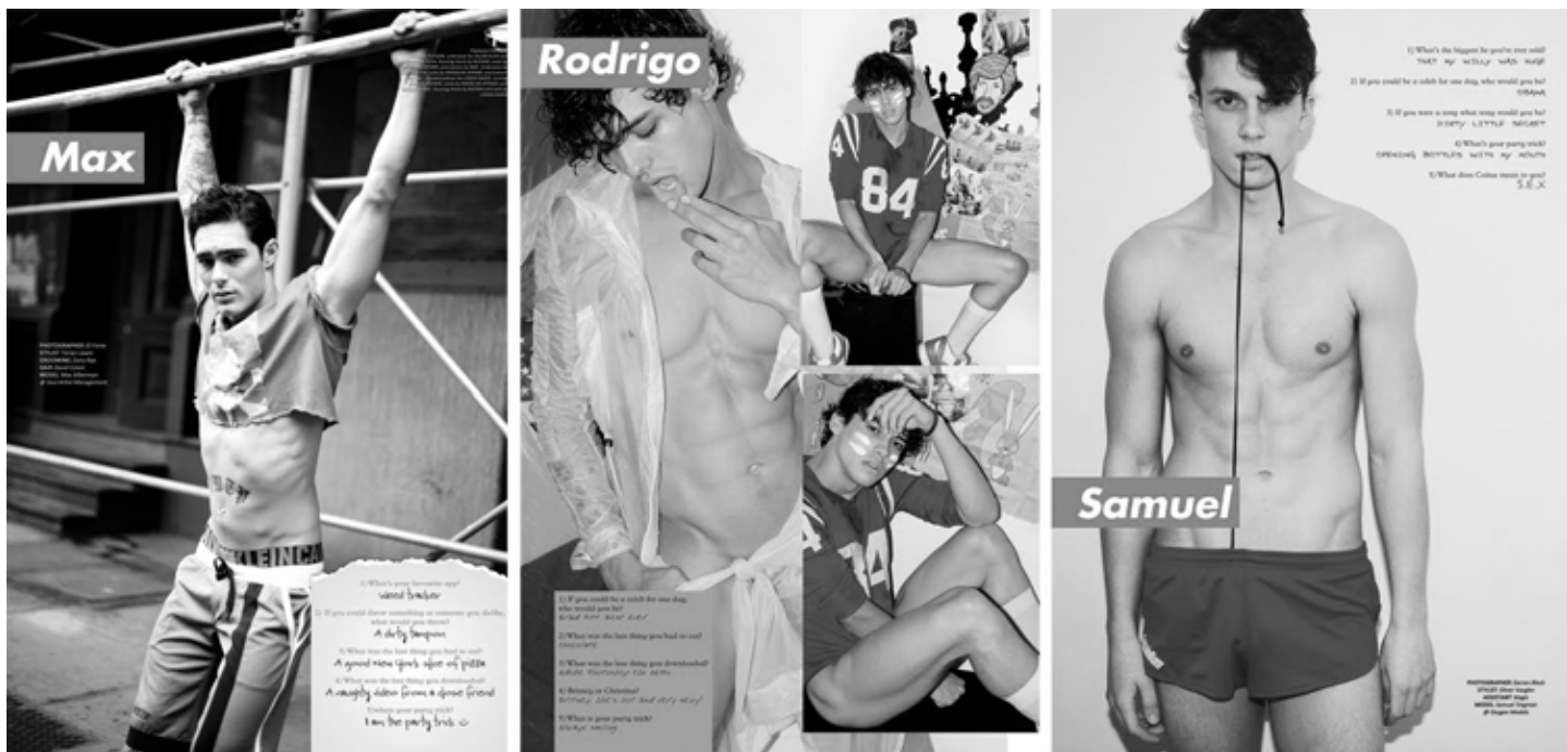
Afbeeldingen in Coitus Magazine.

fantastische foto's van mannen. Maar wat is de macht van deze foto's? De verbazingwekkende modefoto's van bijvoorbeeld Steven Klein en Steven Meisel zijn natuurlijk een ideaal voorbeeld. Hun foto's roepen niet alleen de kwestie van realisme op, maar voor vele kijkers ook het 'echte'. De fascinatie voor het 'echte' is te wijten aan de mogelijkheid om onze herinneringen te creëren. Dit creëert een hechte relatie met het dagelijks leven of met het intieme ervan. Deze intimiteit en het gevoel van het 'echte', veroorzaakt door foto's, en bijvoorbeeld niet bij schilderijen, brengt ons tot de vraag: wat moet zichtbaar zijn en wat moet verborgen worden in het beeld van een man? Belangrijk bij modefoto's is de sociale en seksuele context. Eén van de elementen van deze beelden is dat ze ons doen denken aan de manieren van omarmen: niet letterlijk mannen aanraken, maar narratief het beeld vormgeven in een verhaal over mannen in interactie met elkaar. Deze beelden zijn dus een combinatie van enerzijds de evocatie van gezondheid van het lichaam zelf en anderzijds van het mentaal samenbrengen van lichamen, en misschien zelfs van liefde en haat, lust en wreedheid. De blik van de mannen is zacht en uitnodigend, wie kan vertellen waar één lichaam mentaal eindigt en een andere begint? De grenzen van dat soort beelden zijn erotisch; erotiek wordt vaak gecontroleerd door narcisme.