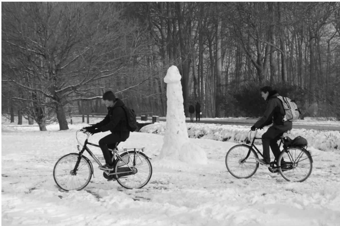
Mannelijk naakt in de openbare ruimte: soms op onverwachte plaatsen, zoals hier op de universiteitscampus in Heverlee van de KU Leuven.