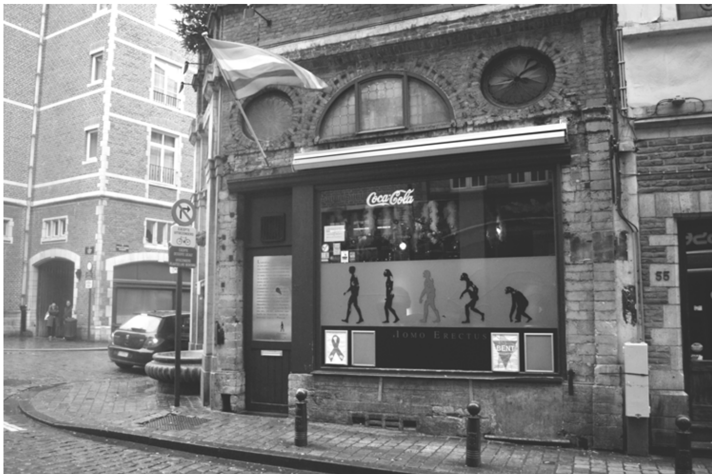
Homo Erectus: een ontmoetingsplaats voor onder andere zwarte gays en biseksuelen.

De zichtbaarheid van zwarte gays en biseksuelen in het verenigingsleven blijft erg beperkt. Toch kan men deze algemene vaststelling iets nuanceren sinds de oprichting van het collectief 'African Pride' in 2012, een vereniging die zich richt tot de in België verblijvende zwarte LGBTQI. We moeten hierbij verduidelijken dat het tot nog toe vooral homo- en biseksuele nieuwkomers (seksuele vluchtelingen) zijn die het meest op het voorplan lopen, in verenigingen zoals OASIS, WISH of RainbowsUnited en door deelname aan de 'Belgian Pride'.