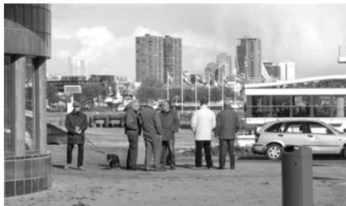
De identiteit van de fietsrentree van de Maastunnel maakt het een aantrekkelijke ontmoetingsplek.

We zien daarnaast in ons onderzoek hoe belangrijk een mogelijke koppeling van reisdoelen is. Een activiteitenaanbod of recreatieve voorzieningen hebben meer kans om door een brede bevolkingsgroep gebruikt te worden als zij op de dagelijkse route van zo veel mogelijk bewoners liggen. Andersom kan een ankerpuntenkaart ook een ontoereikend voorzieningenniveau blootleggen. We kunnen bepaalde functies en activiteiten toevoegen om ankerpunten multifunctioneler te maken zodat het voor diverse bewonersgroepen interessant wordt. Een restaurant in een woonzorgcentrum kan andere bewoners aantrekken door bijvoorbeeld kookcursussen of speciale gezinsaanbiedingen. Vaak hebben zorginstellingen interne voorzieningen zoals muziekruintes of sportvoorzieningen. Ook deze kunnen door verschillende bewoners