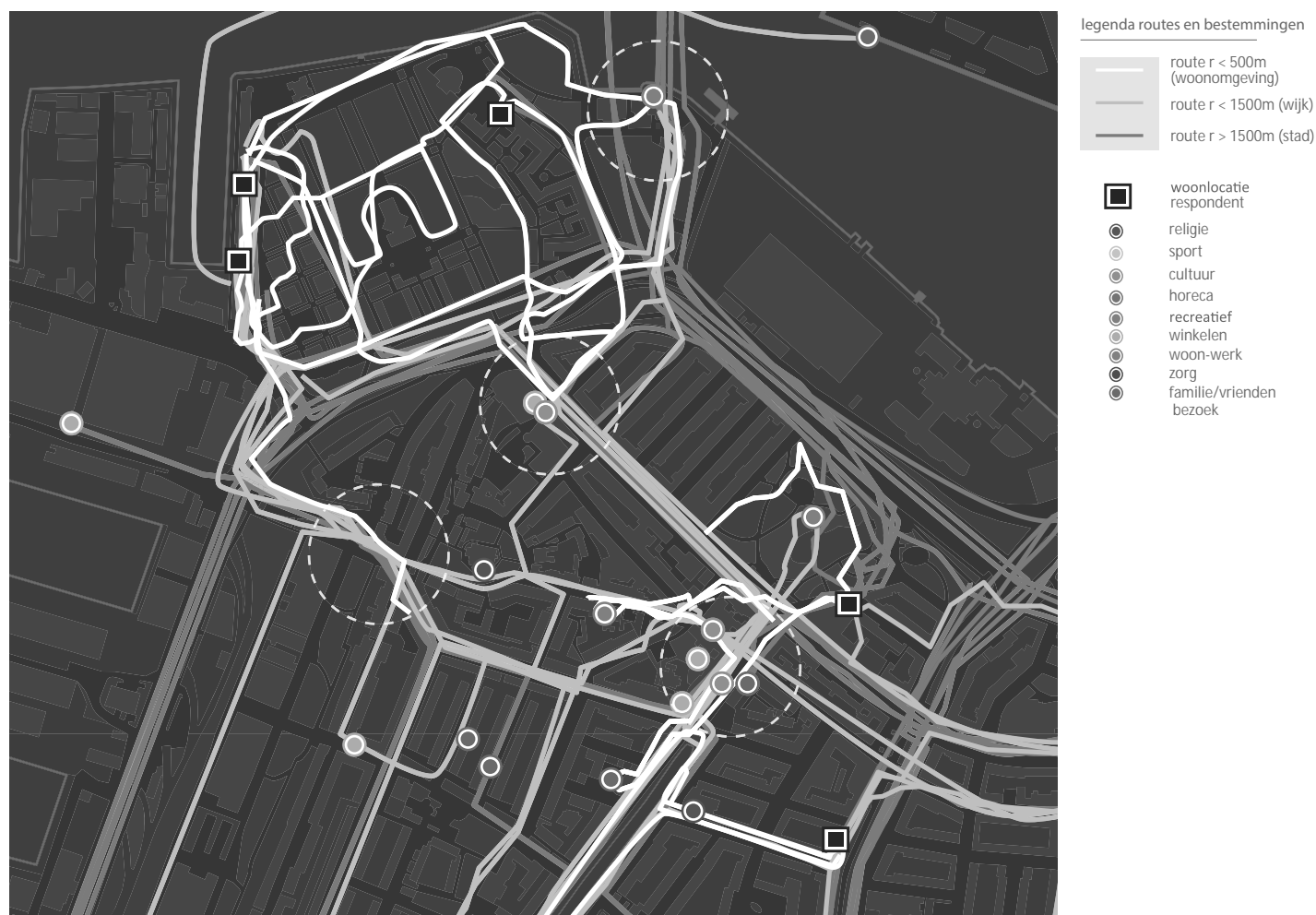
Afbeelding 2: Beweegpatronen gedifferentieerd op basis van afstand vanaf woonlocatie respondent.

Ons uitgangspunt is dat herhaalde ontmoeting in het dagelijkse leven publieke familiariteit bevordert, een cruciale bouwsteen voor sociale relaties. Herhaalde ontmoetingen vinden plaats op plekken die door veel verschillende mensen gebruikt worden. Als het om dienstverlening en activiteiten gaat, worden ouderen echter vaak benaderd als aparte doelgroep. Het voorzieningen- en activiteiten aanbod voor ouderen is in veel gevallen gekoppeld aan woonzorgcentra, of er wordt geworven