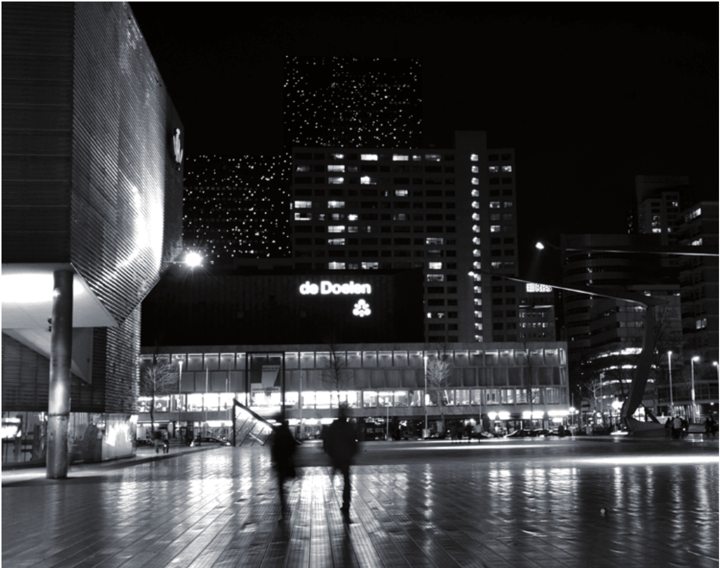
Bright Light Area; Schouwburgplein, Rotterdam.

het gebied waar je het meeste avontuur en gevaar, opwinding en huiver vindt'. Fraai getypeerd, maar vrijblijvend, want zulke inzichten spelen geen rol bij concreet onderzoek. De grote specialist van de 'bright light areas' was Walter Reckless. Toch is er in zijn grondige studie van prostitutie geen verwijzing te vinden naar het belang van de nacht of het nachtleven als zodanig. In de klassieke studie van Harvey Zorbaugh over de 'goudkust en de achterbuurt' vind je de schitterende beschrijving van Clark Street, het 'rialto' van de achterbuurt. De straat is een 'all-night street'. 's Nachts is het een straat van groezelige theatertjes, 'chop sueys' en 'chili parlors' die altijd open zijn, ontelbare kleine dansclubs 'waar koning jazz regeert'. Opnieuw: de nacht is voor uitgaansleven, criminaliteit en andere zaken die het daglicht niet kunnen velen, daar blijft het bij. Een zelfde geluid in een latere etnografie: de studie van een achterbuurt door Gerald Suttles. De meeste buurtcontacten vinden plaats op straat. Iedere bevolkingsgroep heeft een eigen domein, waarbij de jonge mannen zich het verst van huis wagen. Ook 's nachts gaat het buurtleven door en vooral bij lekker weer is het druk: alle stoepanden, portieken en raamkozijnen zijn bezet. Suttles is niet nachtblind, maar net zo min als zijn voorgangers voelt hij zich geroepen de nacht bij zijn (overigens briljante) buurtanalyse te betrekken.