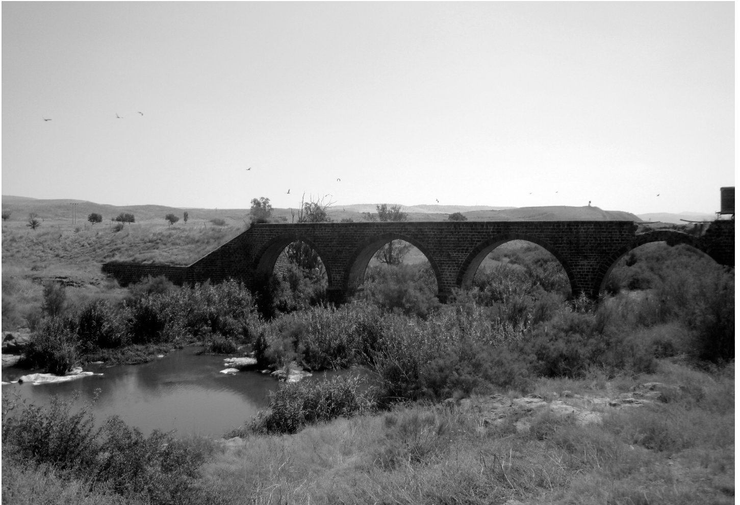
Restanten van de Ottomaanse brug over de Jordaan.

maken tussen bepaalde narratieven, paradigma's en praktijken enerzijds en de natuur, mensen en infrastructuur van het park anderzijds. Vrede wordt zo niet enkel als idee in de plaats geïntroduceerd, het krijgt een tastbare, materiële vorm in het park.