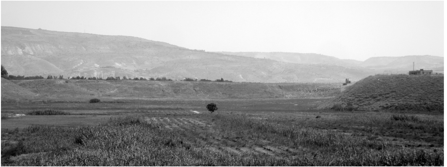
Velden van de Jordaanse boeren in de bedding van het voormalige reservoir van de waterkrachtcentrale.