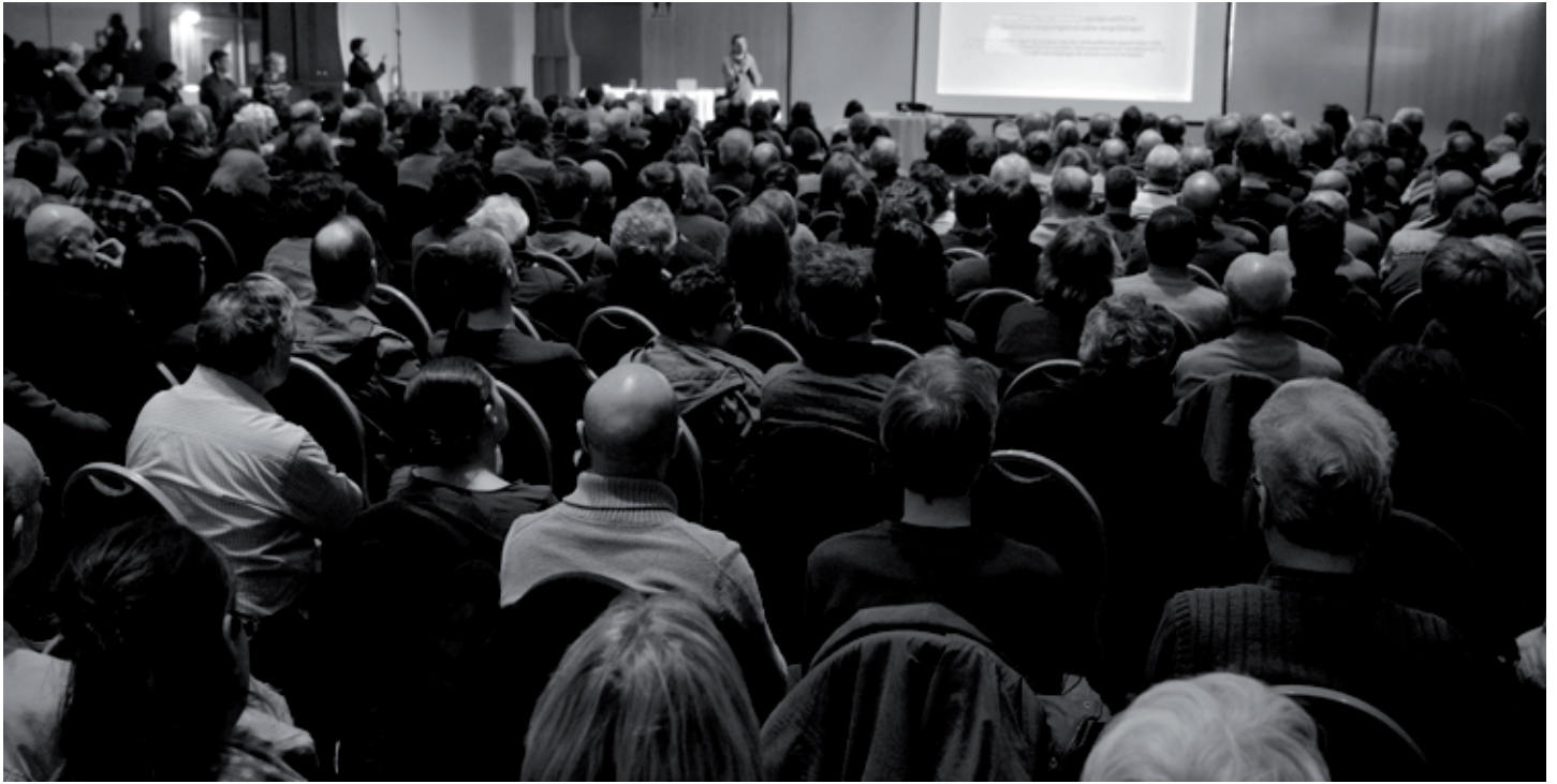
Informatieavond stRaten-generaal over de Oosterweelverbinding.