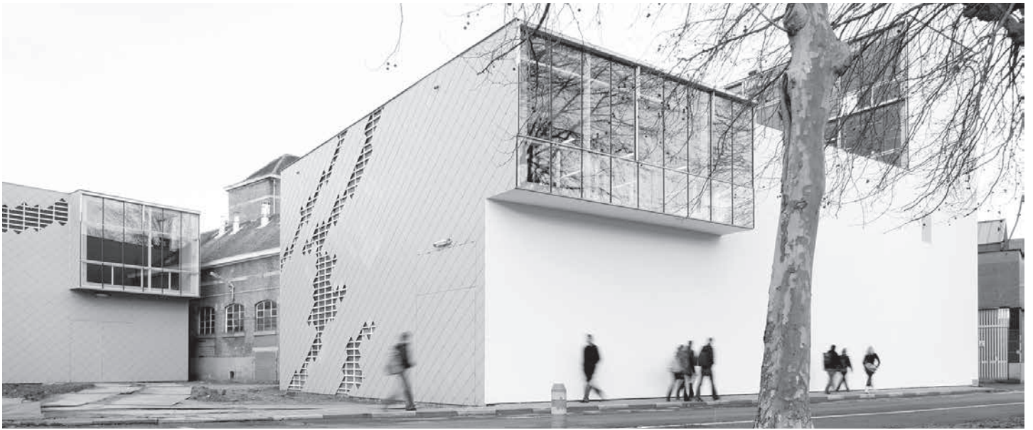
'Groengevel' in Gent. Hoe landschapsonwerp ook niet groen en stedelijk kan zijn.

van ingrepen in het bestaande landschap spelen hierbij een cruciale rol. Bovendien zijn landschappen ontmoetingsruimten: gebieden waar mensen samen tijdelijk of permanent verblijven en die een voortdurend en gemeenschappelijk object van zorg zijn. Het zijn sleutelementen voor individueel en sociaal welzijn en tegelijkertijd belangrijke bronnen voor economische ontwikkeling.