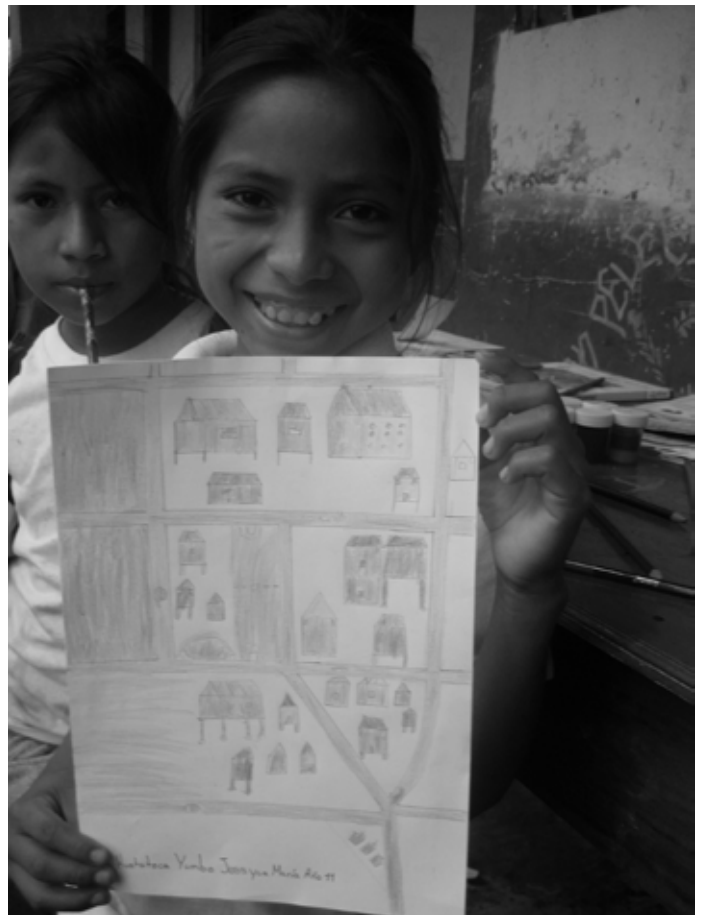
"Mijn comunidad wordt een kleine stad"

Hoewel het gebruik van de sjamaan in de comunidad duidelijk