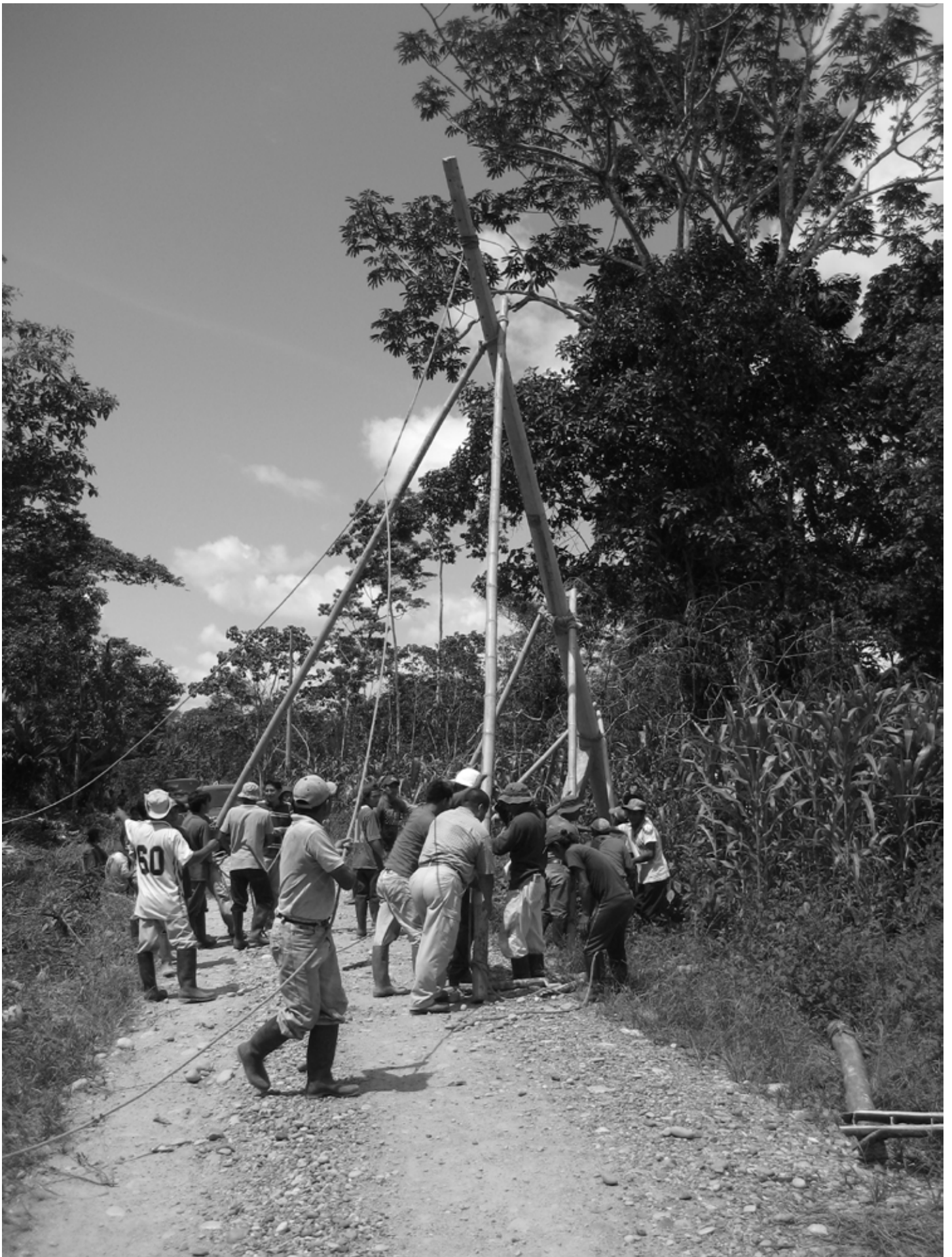
De aanleg van het electriciteitsnet in de comunidad