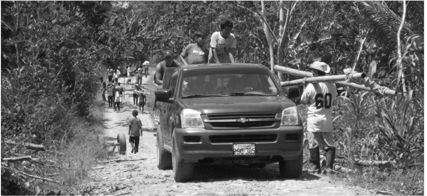
Drukte langs de weg tijdens de wekelijkse 'minga', een dag waarop dorpsbewoners gezamenlijk werk oppakken

tuur is dat de intocht van buitenstaanders kan leiden tot conflicten over land. Hoewel er tot op de laatste dag van mijn veldwerk geen conflicten hebben plaatsgevonden, vormen de ongeorganiseerde en ontbrekende landrechten binnen de comunidad een potentieel probleem voor de toekomst. Een bewoner over de landrechten binnen het dorp: "niemand weet precies hoe het land hier is verdeeld. [...] Er zijn geen documenten, alleen mondelinge overeenkomsten". Dit traditionele systeem van mondelinge overeenkomsten kan onder druk komen staan wanneer buitenstaanders aanspraak willen maken op het land of de grondstoffen op basis van het moderne systeem van geregistreerde landrechten. De bewoners hebben dan geen poot om op te staan.