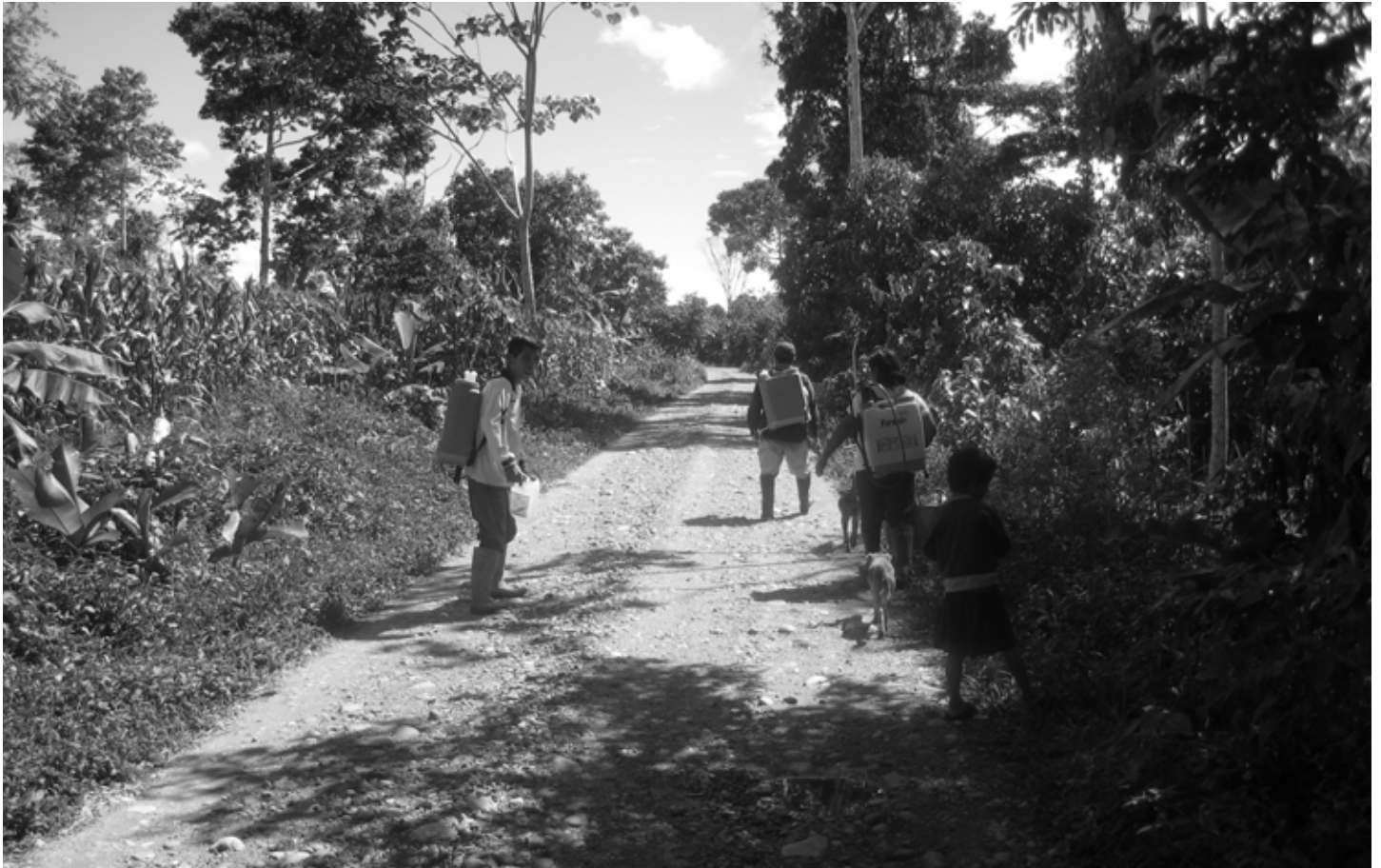
Het pesticidegebruik in de comunidad is sterk toegenomen