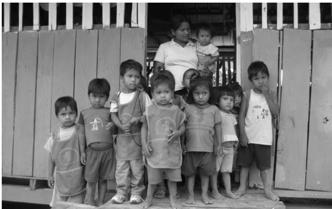
De nieuwe peuterspeelzaal loopt uit

Een andere schaduwkant die veel wordt beschreven in de litera-