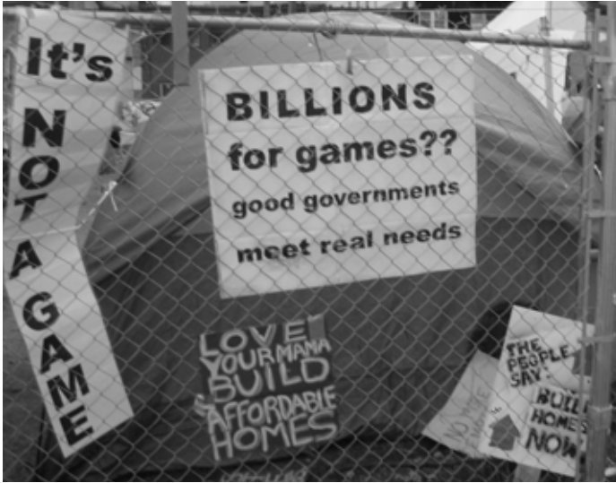
Protesten tijdens de Olympische Spelen van Vancouver in 2010