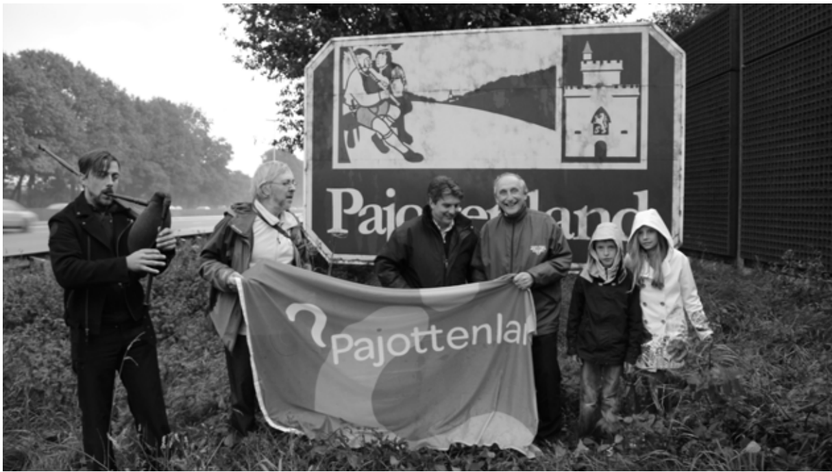
Welkomborden Pajottenland: een ludieke actie voor het behoud van de term 'Pajottenland'

perfect voor gekozen worden om bepaalde zaken te vermarkten op een grotere schaal en andere op een kleinere. Natuurlijk impliceert het wel dat actoren van een bepaalde streek samen moeten werken met hun collega's uit andere streken. Als je in Houffalize of La Roche een toeristisch infokantoor binnenstapt, zal je bijvoorbeeld zien dat de trekkers van het nieuwe "Parc Naturel des Deux Ourthes" het imago van de Ardennen niet bekampen met een nieuw logo en een nieuwe identiteit, maar dat ze er doelbewust voor hebben gekozen om zoveel mogelijk producten en activiteiten onder de vlag van de Ardennen te promoten. Enkel voor meer specifieke zaken wijzen ze op de deelregio van Les Deux Ourthes. Op die manier zetten ze hun eigen streek in de markt zonder de omliggende streken voor alles te beconcurreren.