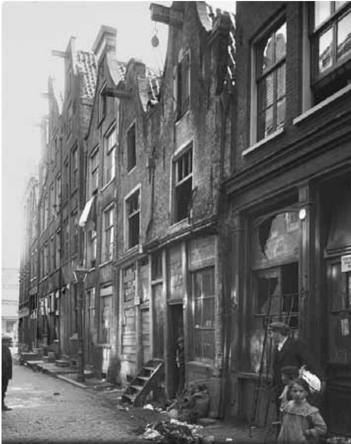
Krotwoningen anno 1925 in de Jodenbuurt Amsterdam

krijgt. In een snelgroeïende stad moet de wijk een overzichtelijke eenheid vormen. Vrienden opzoeken, recreëren en winkelen doe je allemaal in de wijk. Alleen voor werk moet je de wijk uit, omdat de functiescheiding zorgt voor een grotere afstand tot de fabriek. En als je toch wil verhuizen, omdat door gezinsuitbreiding het huis te klein wordt dan moet dat binnen de wijk kunnen. Dit idee staat ook wel bekend als de wijkgedachte. De stedenbouwkundige structuur zou dienstbaar en sturend moeten zijn voor het creëren van deze microsamenleving. De openbare ruimte is zodanig ontworpen dat mensen elkaar kunnen ontmoeten op een plein, speelveld of wandelpad. Ideologisch gezien kiezen modernisten voor het stimuleren van 'gelijkheid' in de samenleving. De architectuur straalt eenvoud en eenvormigheid uit, waardoor je niet aan het huis kan afleiden of iemand rijk, arm, jong of oud is. En moderne technieken als elektriciteit en eenvoudige temperatuurregeling in huis moeten het leven voor iedereen veraangenamen. Uit deze ideeën kun je een maakbaarheid- en vooruitgangsgeloof ontwaren.