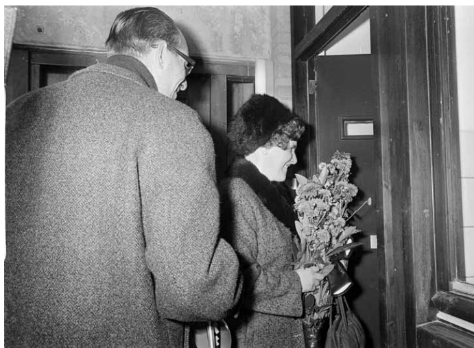
Eerste bewoners van Bijlmermeer

Wagenaar, C. (2012), Town Planning in The Netherlands since 1800.