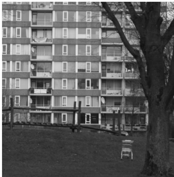
Openbare ruimte in Overvecht

En als klap op de vuurpijl raakt ook nog de moderne architectuur uit de mode. Een woning is een consumptiegoed geworden, waarmee