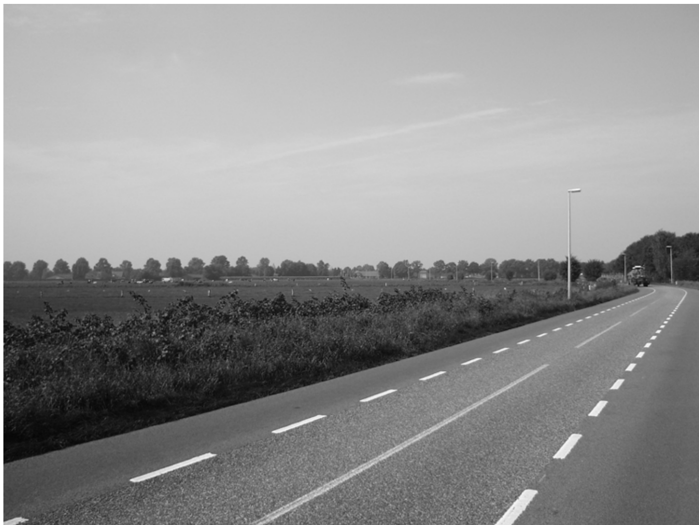
Fietspaden in het buitengebied: ondanks de markeringen niet altijd de veiligste route

Kinderen beperken zelf ook hun eigen bewegingsvrijheid. Tijdens de focusgroep interviews vertelden kinderen dat zij bepaalde locaties in de dorpen vermijden vanwege andere mensen. De beperkingen die kinderen zichzelf opleggen zijn dus niet te herleiden tot dezelfde toestanden die de eilandisering veroorzaken – verkeersdruk en afstanden – maar vormen een additionele beperking van de bewegingsvrijheid voor kinderen. Angst voor vreemden is ook een reden om bepaalde locaties op het platteland te vermijden. De kinderen waren er van overtuigd dat er in hun dorpen veel minder 'gevaarlijke mensen' waren dan in de steden. Desalniettemin vertelden zij over 'gevaarlijke' volwassenen – volwassenen die je beter kunt vermijden