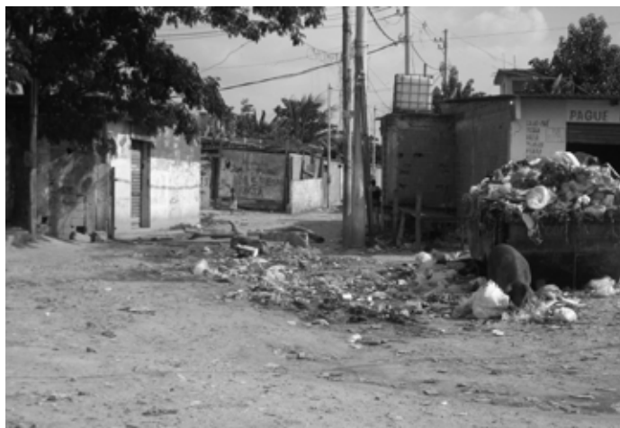
De hoofdentree van Terra Encantada

Dit is geen nieuwe opvatting. Al in 1926 noemde Mattos Pimenta, een vooraanstaande arts, de favelas een gevaar voor de openbare gezondheid. Hij koppelde onhygiënische omstandigheden bovendien klakkeloos aan moreel verval. Ook nu nog maakt de ophoping van vuil aan de grenzen van de favela het gemakkelijk om favelas als onhygiënische plaatsen en de bewoners als vies en gevaarlijk te beschouwen. Favelabewoners worden dan ook gestigmatiseerd en uitgesloten door de bredere maatschappij, hoezeer die ook van hun goedkope arbeid afhankelijk is. De sterke fysieke grenzen isoleren de favela dus niet alleen in ruimtelijk opzicht, maar staan vanwege