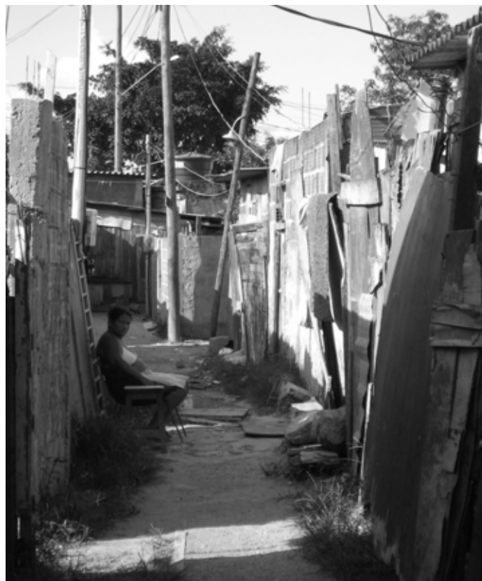
Muren en schuttingen bakenen de privéruimten duidelijk af

Ten derde houdt de handhaving van de openbare orde en de zorg voor openbare veiligheid op aan de grens van de favela. Ik maak regelmatig een praatje met kinderen die ik tegenkom op straat. Op een van die momenten vragen ze mij of ik niet bang ben om alleen door de favela te lopen. Ik zeg van niet, ervan uitgaande dat ze weten dat mensen van buiten de favela bang zijn van de mensen erbinnen. Ik ben me meteen bewust van mijn eigen vooroordeel en vraag ze dan, 'Waarvoor zou ik dan bang moeten zijn?' Ze moeten