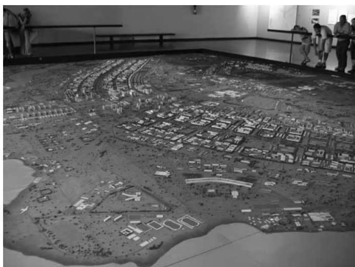
Model van creatiestad Brasilia van stedelijk planner Lúcio Costa. (Afbeelding vrijgegeven onder GFDL).