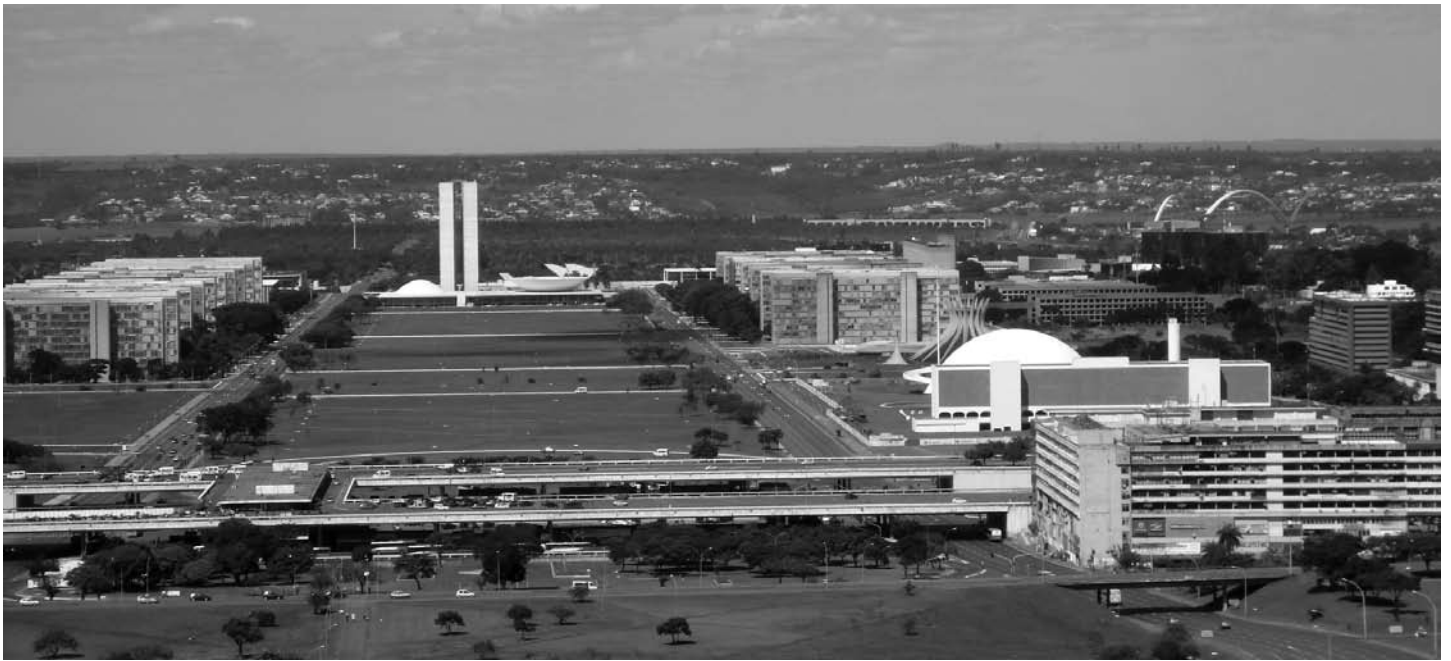
Creatiestad Brasilia van stedelijk planner Lúcio Costa en architect Oscar Niemeyer.