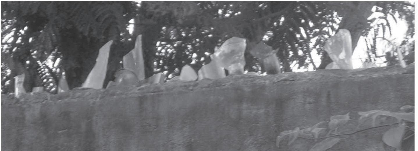
Muren met schrikdraad en glasscherven