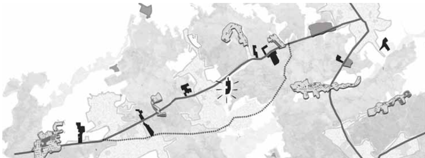
Systeem van Plugins met aanduiding ontwerpsite