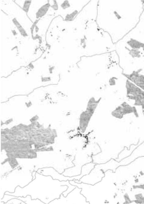
1860 bebouwing, bebouwing en waterlopen