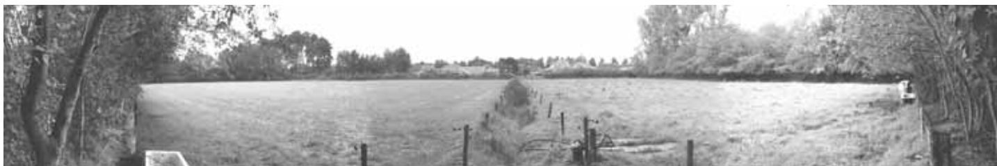
Huidige toestand 'kamer' op de projectsite