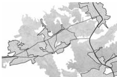
Kernen en infrastructuur

De interne organisatie van de 'plugin' bouwt voort op de keuzes die gemaakt werden in de vorige stappen en geeft vorm aan de vooropgestelde gefaseerde ontwikkeling. Er werd geopteerd voor één algemene ontsluiting of toegang die aansluit op een centrale kamer, welke van daaruit de gehele ontwikkeling verder ontsluit. Deze organisatie voegt een stedelijke kwaliteit toe op basis van een gemeenschappelijk plein en vermijdt onnodig doorgaand verkeer. In