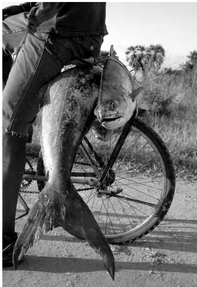
De fiets als transportmiddel in Tanga, Tanzania

merken en percepties van de doelgroep en dat deze duidelijk verschillen met die van Nederlandse reizigers. Het laat zien dat reizigers zich in verschillende stadia bevinden en dat een veel gericht fietsbeleid kan worden gevoerd door interventies op de doelgroep af te stemmen.