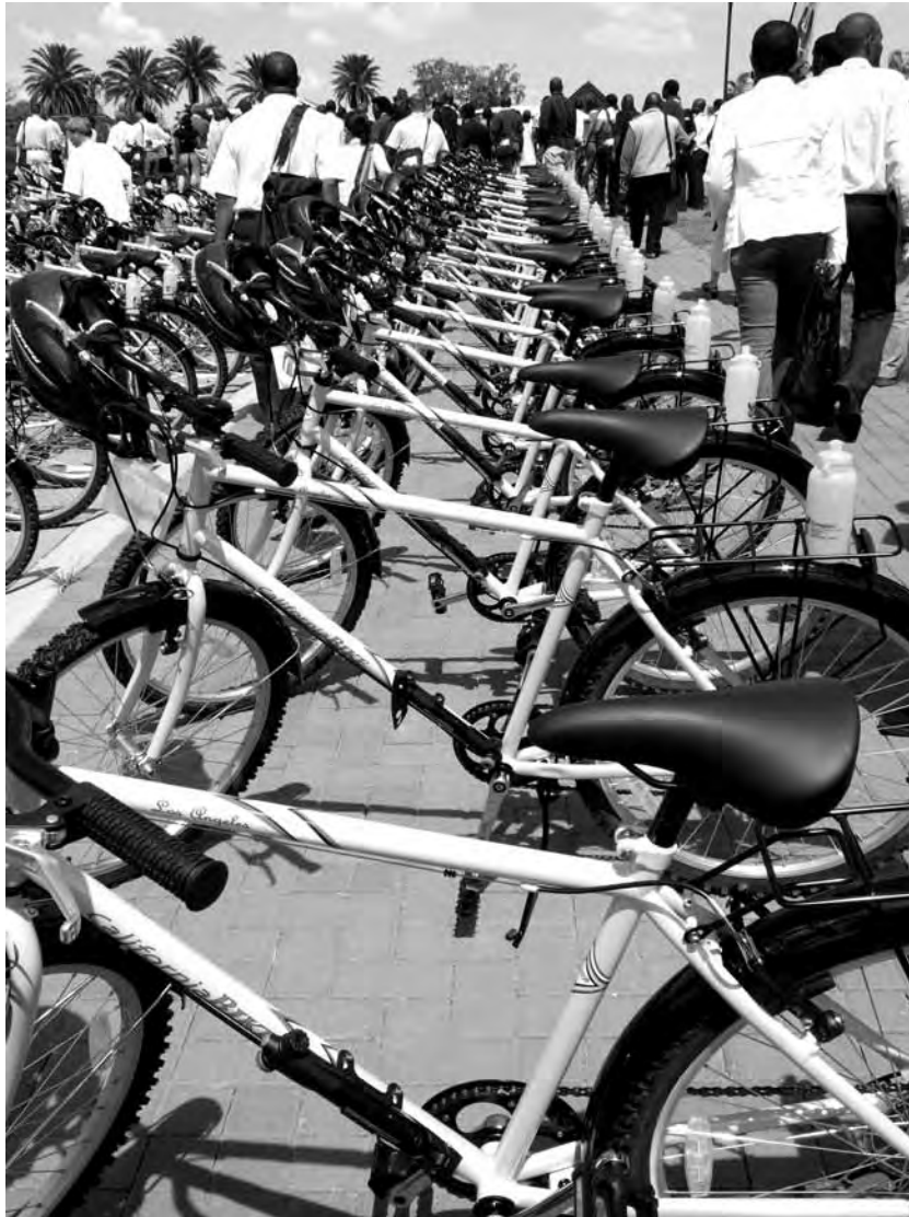
Cycle rally om fietsen te promoten in Midrand, Zuid Afrika

vervoerswijzen die moeten worden gefaciliteerd en de prioriteit die iedere vervoerswijze moet krijgen. Hierdoor is het mogelijk een nieuwe planning en ontwerpbenadering te kiezen die specifiek aandacht besteedt aan fietsen en lopen. De studie zal resulteren in beleidsaanbevelingen voor stedelijke verkeersplanners die kunnen leiden tot een beter ontwerpproces en ontwerp van weginfrastructuur.