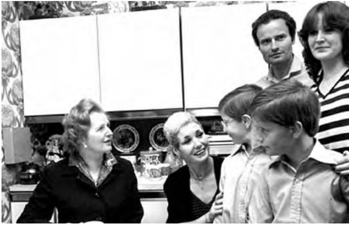
De Britse Eerste Minister Margaret Thatcher viert the verkoop van de 12.000ste 'Right to Buy' sociale woning in 1980