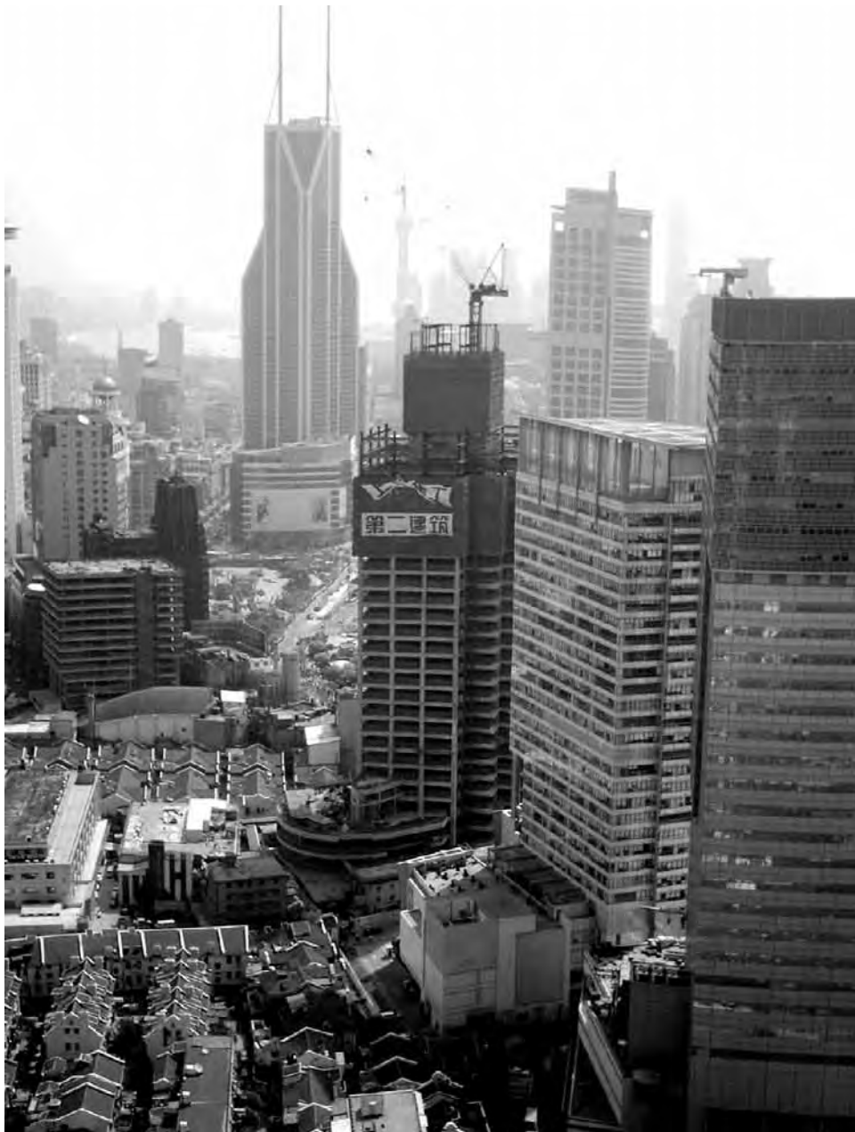
Oude arbeiderswoningen naast hoge wolkenkrabbers in Shanghai