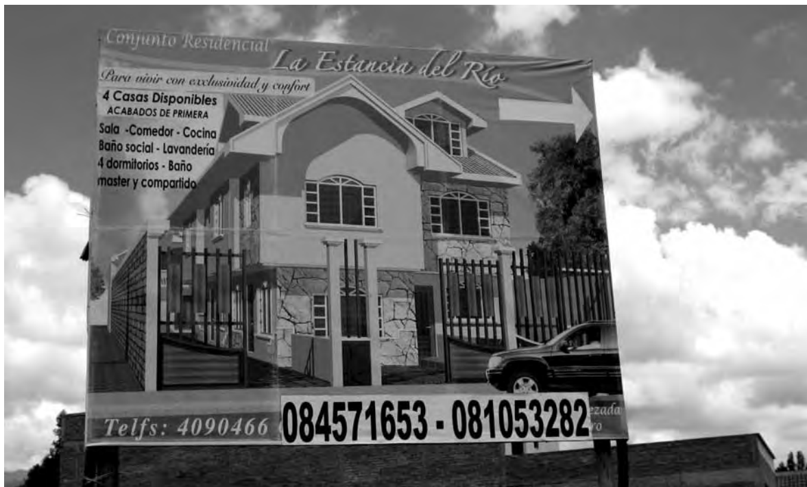
Reclame voor Collinas de Challuabamba in Cuenca

gramma's werd de bestaande kloof tussen arm en rijk nog groter. Als gevolg daarvan nam de criminaliteit toe en hierdoor ook de behoefte aan beveiligde wijken. Tegelijkertijd kreeg de private sector vanwege de privatisering en decentralisering van overheidstaken een grotere rol bij de aanleg van woonwijken. In de kleine steden waar stadsplanning geen prioriteit had, nam de greep van de overheid op de stedelijke ontwikkeling drastisch af.