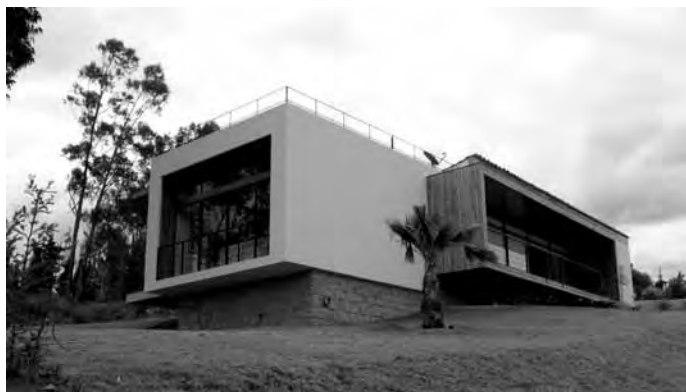
Villa in Collinas de Challuabamba

Bekende antropologische studies over lokale elitevorming van Abner Cohen, Pierre Bourdieu en Ulf Hannerz beschrijven hoe de sociale voorrechten van een elitegroep samenhangen met de exclusiviteit van de culturele codes die ze gebruikt om zich van de rest te onderscheiden. Zodra die symbolen door een te grote groep gedeeld worden, verliezen ze hun exclusiviteit en boet de elite aan macht in. De woonomge-