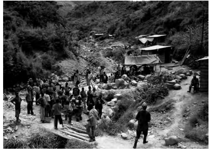
De 'carrière' waar creuseurs naar goud komen graven

jaren geleden al gegraven door het Belgische mijnbouwbedrijf SOMINKI dat er aan exploratie en exploitatie deed. Maar in 1996, toen Laurent Kabila vanuit het oosten naar Kinshasa oprukte en ook in Kamituga passeerde, trok SOMINKI er weg.