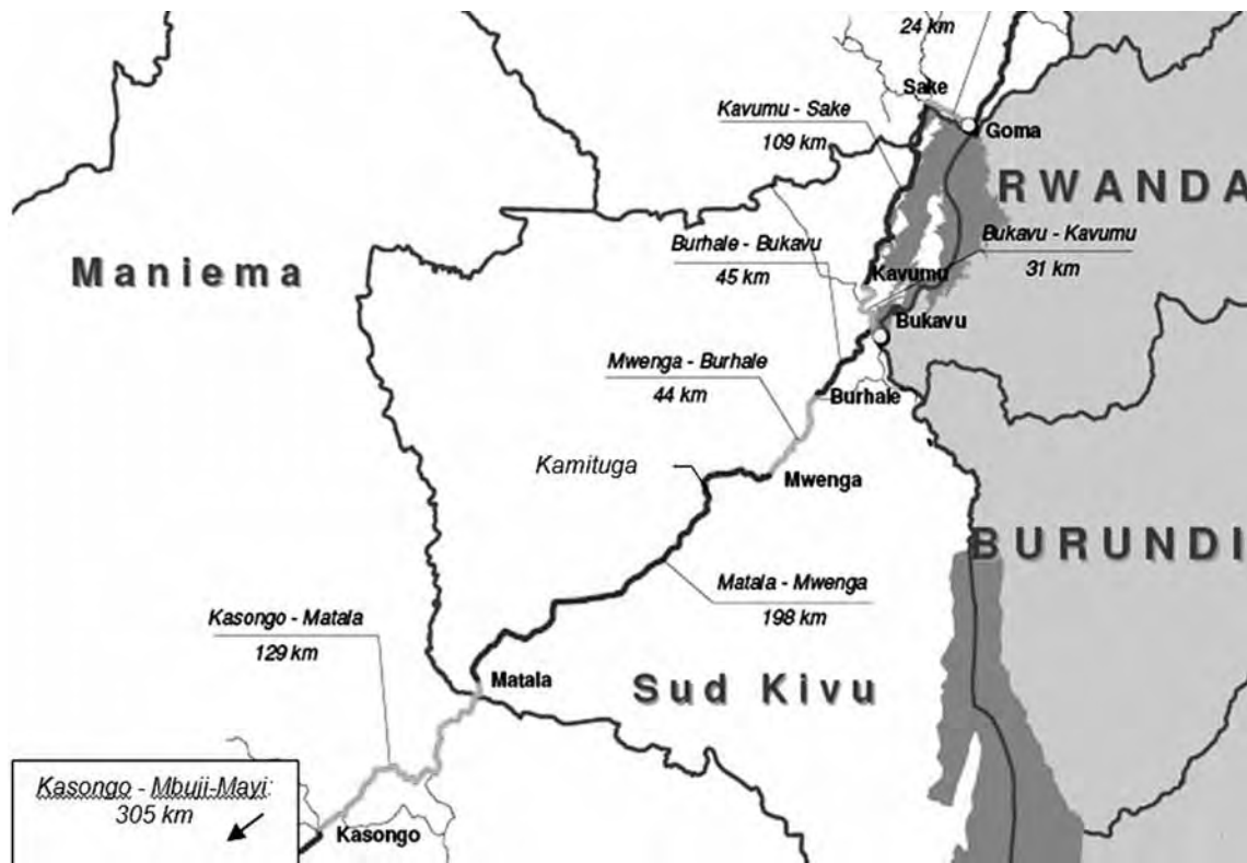
Route Nationale 2, met situering van Bukavu, Mwenga, Kamituga en Kasongo

omwille van slecht onderhoud of tijdens het regenseizoen – is reizen naar Kamituga moeilijk. Maar tegelijk maakt Kamituga ook volop deel uit van regionale en globale dynamieken.