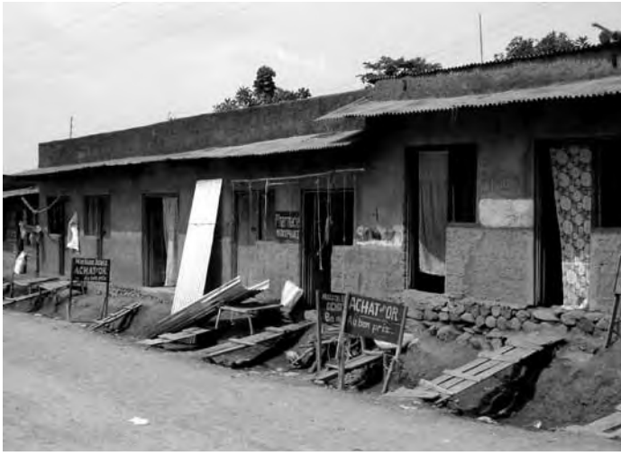
'Maisons d'achat' in de straten van Kamituga

wilden, telden 1 dollar neer per kilo goud en 100 dollar voor een passagier. Eén van de gevolgen was dat de lokale markt meer en meer gedomineerd werd door enkele kapitaalkrachtige handelaars die opereerden vanuit Bukavu. Zo bleef Kamituga ook tijdens de oorlog, hoewel het fysiek bijna volledig was afgesneden van de buitenwereld, verbonden met de globale dynamieken.