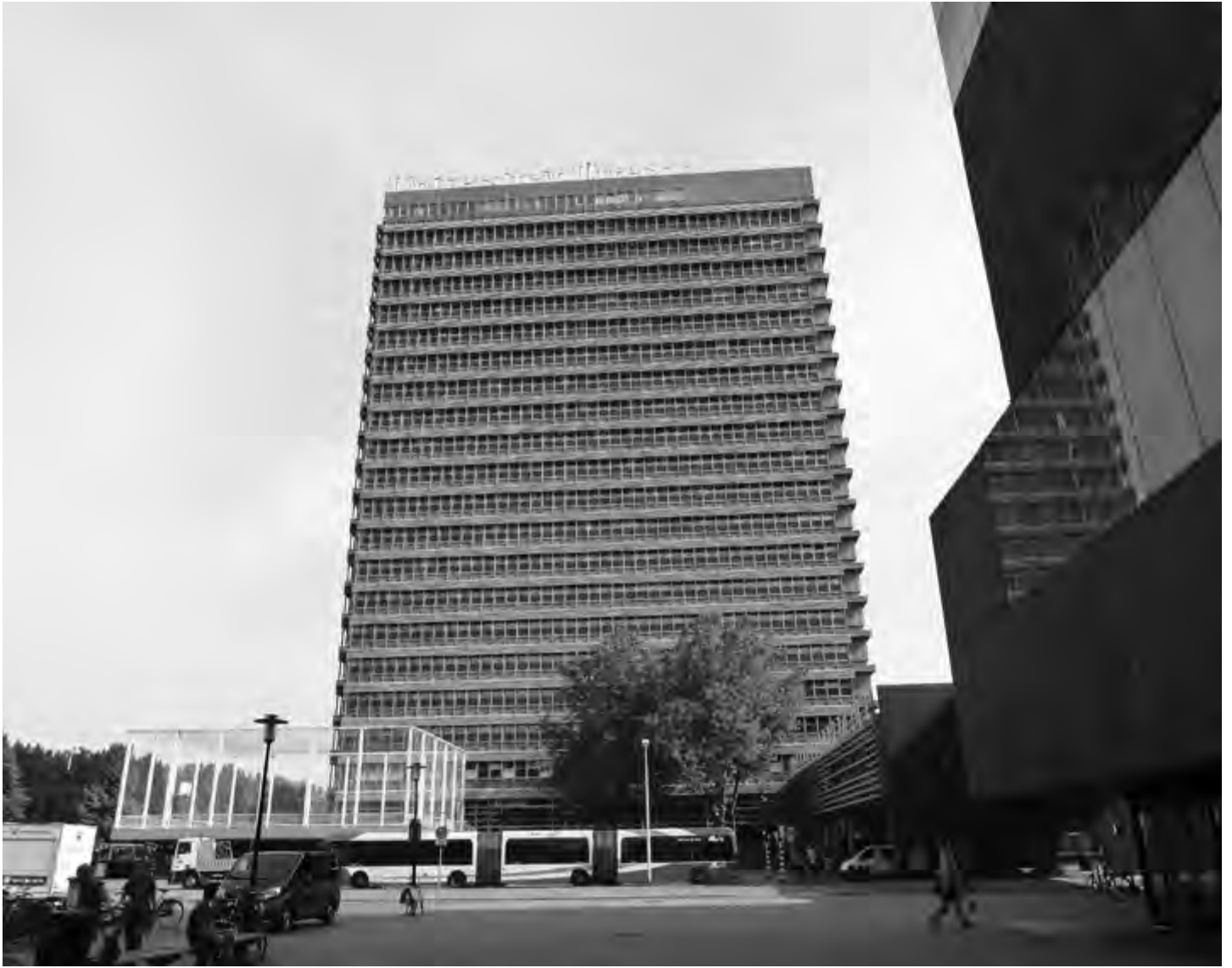
Verskillende lagen van een turbulente planologische geschiedenis: noodgebouw 'Transitorium 2' en de prijswinnende Universiteitsbibliotheek.

aangelegd. De grens werd getrokken en vormde in zijn geometrie een scherpe afbakening en loskoppeling van de historische rurale landschapsstructuur. De universiteit creëerde een tabula rasa waarop een blauwdruk kon worden getekend.