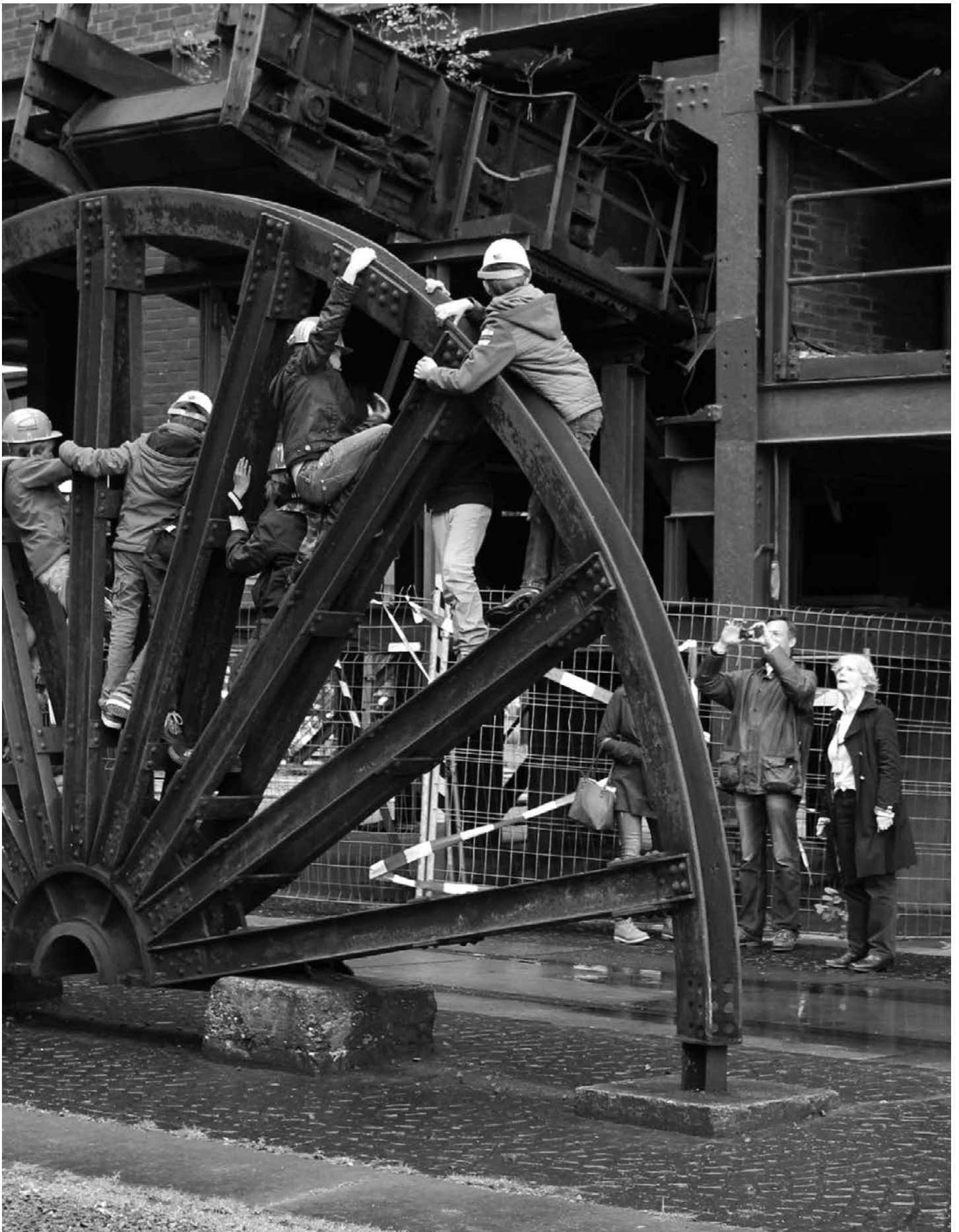
Foto 2: De veranderde betekenis van het mijnbouwerfgoed in de Ruhr wordt door de aanwezigheid van toeristen duidelijk zichtbaar.