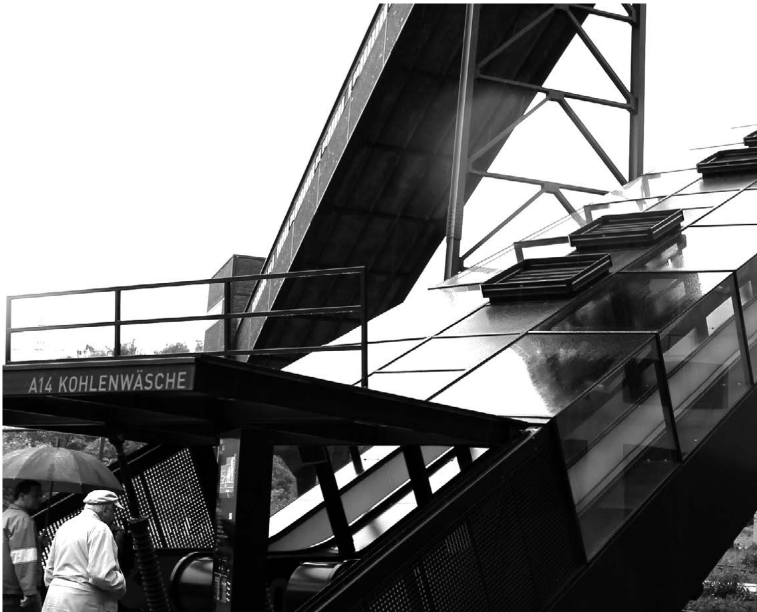
Foto 4: Ontsluiten van objecten voor toerisme betekent toegankelijk maken. Hier gebeurde dat letterlijk met een transformatie van kolenwasserij naar museum, mede door een grote trap tegen de gevel te plaatsen.