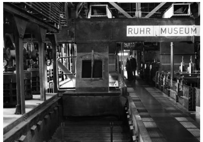
Foto 3: Veel van de oude structuren is in stand gehouden, zoals in het museum is te zien.