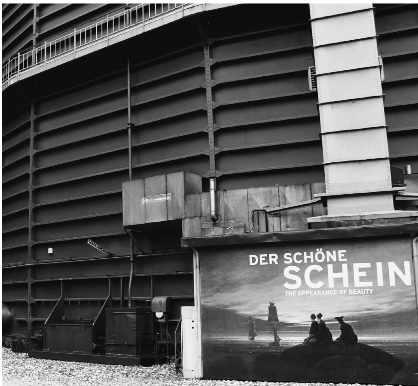
Foto 6: Buiten de gashouder wordt de nieuwe rol als kunsthall aangeprezen met grote borden.