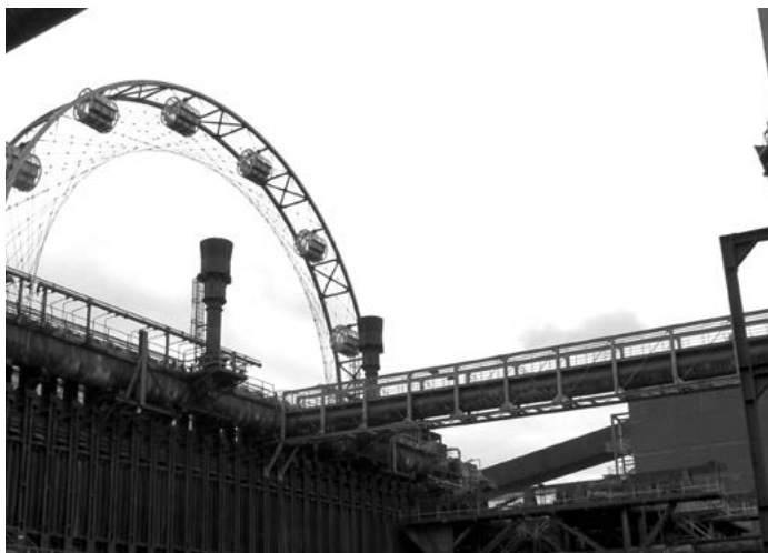
Foto 1: Op sommige plaatsen is de Ruhr op een pretpark gaan lijken.