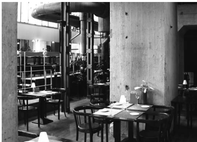
Foto 5: Een deel van de nieuwe Ruhr-beleving is dineren tussen de oude installaties.