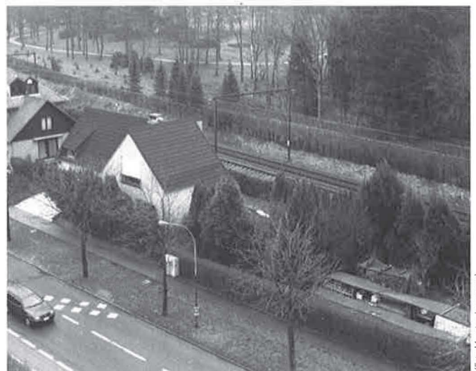
Mobiliteit als voorwaarde.