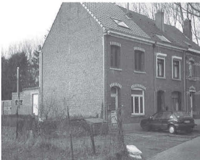
Wonen in losse flarden.