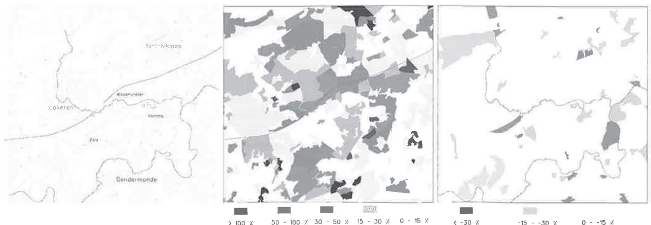
Figuur 1 - Bevolkingsgroei en -afname in het studiegebied Lokeren-Sint Niklaas-Dendermonde.

Anderzijds wordt de nevelstad gevormd door het op verschillende plaatsen ontstaan van ongecontroleerde, spontane initiatieven op perceelsniveau, de 'trillingen'. Het zijn voornamelijk deze