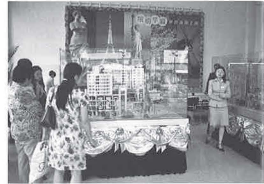
Foto 3 - De maquette van een te bouwen winkelcentrum in Zhengyi Lu, Kunming. De panelen op de achtergrond verwijzen naar de op Europese en Amerikaanse voorbeelden geïnspireerde 'flavor zones', waaruit het centrum zal bestaan.

stratenblok van twee verdiepingen hoge 'shop houses'. De bovenste verdiepingen dienen als woonvertrekken, de ondersten hebben een commerciële functie. Een wandeling door dergelijke straten is een rijke sensuele ervaring. Uitlaatgassen ontsnappen aan de lage afvoerbuizen, op straat zijn etenswaren uitgesteld, de bakpannen produceren harde sissende geluiden en exotische geuren en mannen spugen er luidruchtig op de grond. Het interieur en exte-