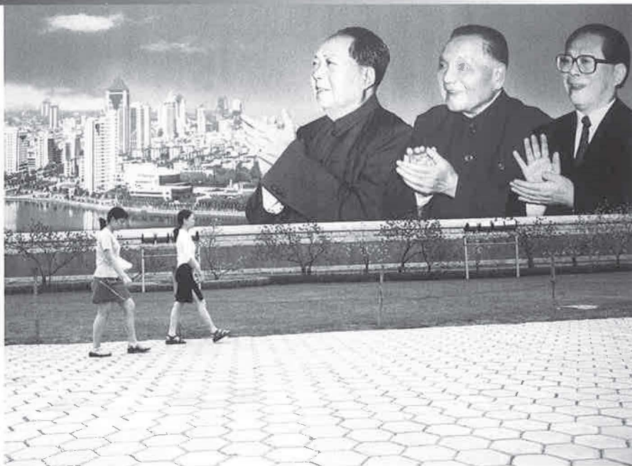
Foto 7 - Het verstedelijkingsproces in China is nadrukkelijk door de staat geïnitieerd. Op centrale plekken van Chinese steden, zoals op het Minzu Dadao in Nanning, zijn billboards en aanplakborden geplaatst, waarop de toekomstige koers breed is uitgemaakt. Van links naar rechts wijzen Mao Tse Tung, Deng Xiaoping en Jiang Zemin de weg.

Het mondaine en kosmopolitische karakter van dit winkeldistrict leidt ook tot subtiele sociale adaptaties. Op de brede promenade flaneren jonge meisjes op twintig centimeter hoge plateau-