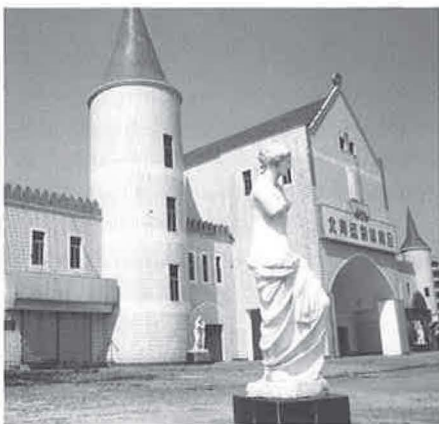
Foto 9 - Toegangspoort tot een amusementscomplex in het Silver Beach Touring Resort in Beihai.

huizen families, die de kapotte ramen en deuren met spaanplaten en karton hebben afgedicht. Aan de overkant van de boulevard ligt een compleet vakantiedorp er ontheemd bij. Franse villa's, Zwitserse chaletten, sprookjeskastelen, Romaanse beeldengalerijen, een arena (bedoeld voor het houden van hanen- en paardengevechten en 'freakshows'), zwembaden en fonteinen. Het park vormt een samenraapsel van eclectische architectuur, waaruit het water is weggelopen, waarvan de verf afbladdert en waar bizons, ratten en wilde paarden de