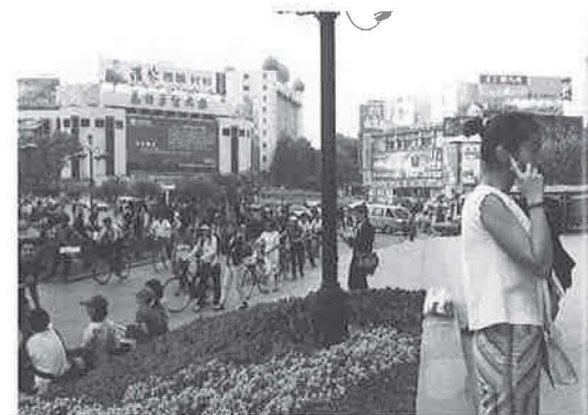
Foto 5 - Mobiliteit en kosmopolitisme. Een verhoogde promenade op Zhengyi Lu in Kunming.