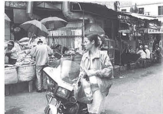
Foto 4 - Multifunctioneel en sensueel. Een traditionele publieke ruimte in een zijstraat van Dongfeng Lu, Kunming.