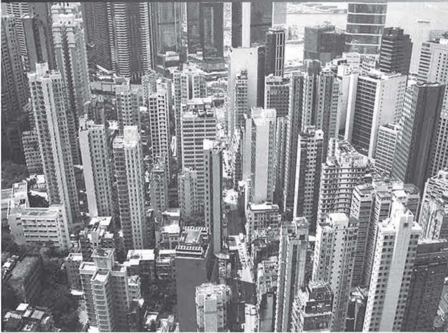
Foto 2 - Zicht op Hong Kong Island. De slanke en hoge gestalte van de flatcomplexen is het gevolg van hoge grondprijzen en de sociaal gewenste indeling van appartementen, waarbij vanuit ieder vertrek zicht is op de buitenwereld.

gedomineerd door een socialistische vorm van ruimtelijke organisatie. Steden waren grotendeels opgebouwd uit zelfstandige, vier tot vijf etages tellende woon- en werkcomplexen, door muren van elkaar gescheiden. Tussen deze 'compounds' en de schaarse traditionele bouwwerken liepen meestal brede monumentale straten. De laatste twee decennia wordt de Chinese stad echter een ander profiel aangemeten (foto 7 en 8). In het nieuwe stedelijke landschap springen drie elementen in het oog. Allereerst groeien steden behalve in horizontale vooral in verticale richting. De nieuwe skyline wordt niet overheerst door pagodes en tempels, maar door high-tech kantoorcomplexen, winkelcentra en appartementencomplexen (foto 1 en 2). Daarnaast heeft de omloop van het auto- en fietsverkeer een centrale rol in de nieuwe steden, waar oude stadsbuurten wijken voor brede vier- tot achtbaanswegen. Ten derde is een nieuwe ruimtelijke structuur in de maak, gebaseerd op het principe van 'multi-nucleation'. Als gevolg van de sterke groei van de tertiaire sector en de gedeeltelijke privatisering van de grondmarkt, waarbij de staat aan investeerders lange-termijnleningen verstrekt, komt ruimte vrij voor de ontwikkeling van gespecialiseerde stadsdistricten. Hoogbouw, verkeerscirculatie en functiescheiding; het door de Chinese staat geïnitieerde moderniseringsproces heeft, sterk beïnvloed door westerse