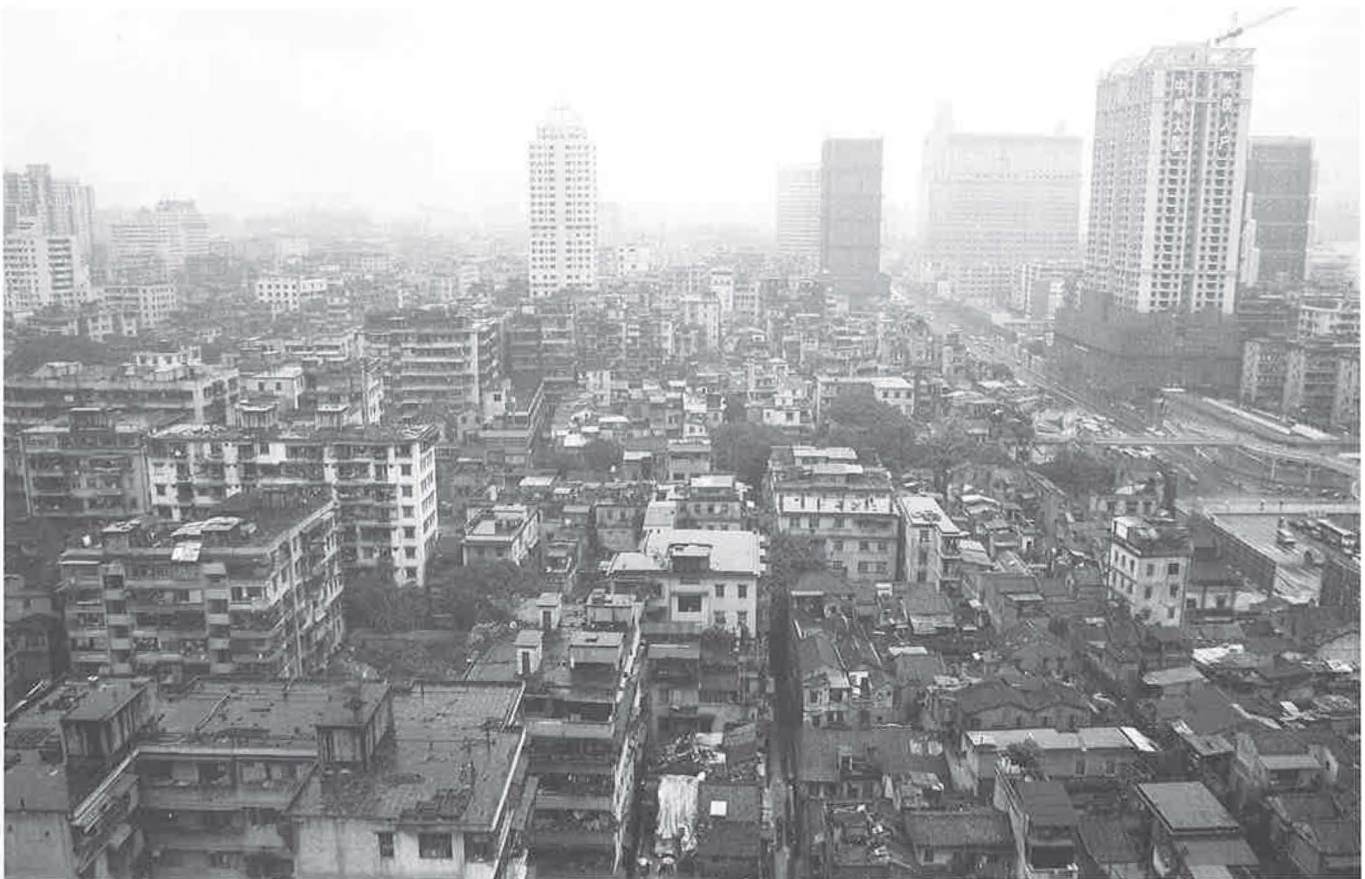
Foto 1 - Panorama van Guangzhou. Het door de Chinese staat geïnitieerde moderniseringsproces heeft een drastisch effect op het stedelijke landschap. In snel tempo en op grote schaal wijken oude stadsbuurten voor bankgebouwen, hotels en appartementencomplexen.

Chinese steden onderscheidden zich lange tijd weinig van elkaar. De stedelijke structuur en morfologie werd