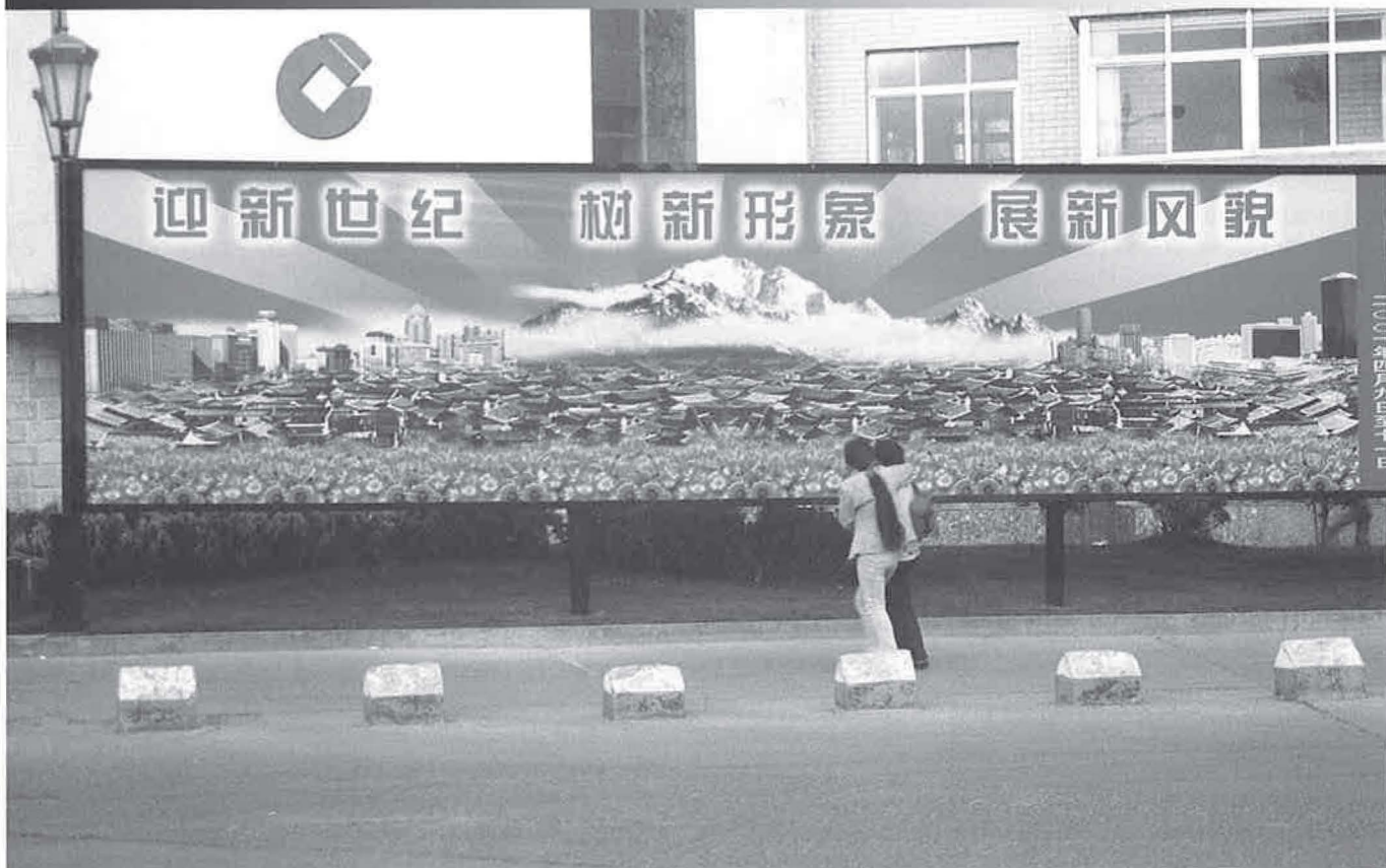
Foto 8 - Promotiebord in Dong Daji, Lijiang, waarop het oude, door de UNESCO beschermde stadsgezicht, en de recente stadsuitbreiding zijn afgebeeld. De afbeelding is een vertekende weergave van de werkelijkheid. In het midden de oude stad, geflankeerd door nieuwbouw, en op de achtergrond de Jade Dragon Snow Mountain.

huizen families, die de kapotte ramen en deuren met spaanplaten en karton hebben afgedicht. Aan de overkant van de boulevard ligt een compleet vakantiedorp er ontheemd bij. Franse villa's, Zwitserse chaletten, sprookjeskastelen, Romaanse beeldengalerijen, een arena (bedoeld voor het houden van hanen- en paardengevechten en 'freakshows'), zwembaden en fonteinen. Het park vormt een samenraapsel van eclectische architectuur, waaruit het water is weggelopen, waarvan de verf afbladdert en waar bizons, ratten en wilde paarden de