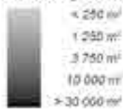
Percelering in en om het Peerdsbos, 5x5km

De Antwerpse woonbossen: dorpen en woonparken in de bossen (links) en versnippering (rechts)