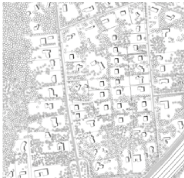
Business as usual

bewoners van de nevelstad bijvoorbeeld wordt gevraagd naar de voordelen van wonen in het gebied, komt de landschappelijke kwaliteit (omschreven als rust, groen en 'wonen op den buiten') steevast naar voor als een van de belangrijkste.