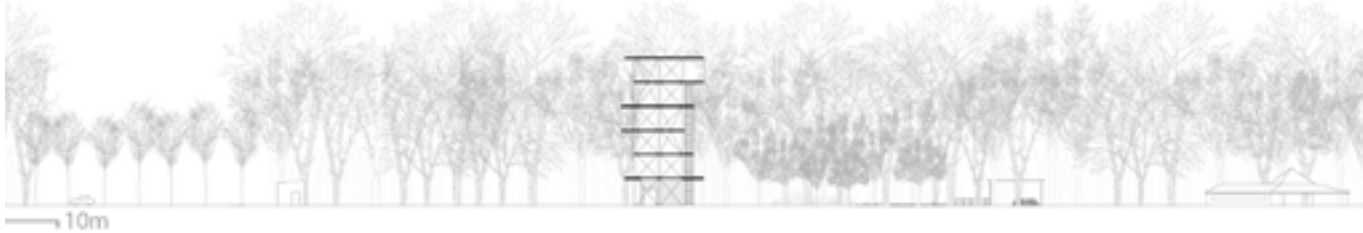
Collectieve ontwikkeling van meerdere percelen (onder), met een collectieve en publieke open kruidlaag en intimiteit in de kruinlaag (boven, 360° aanzicht)