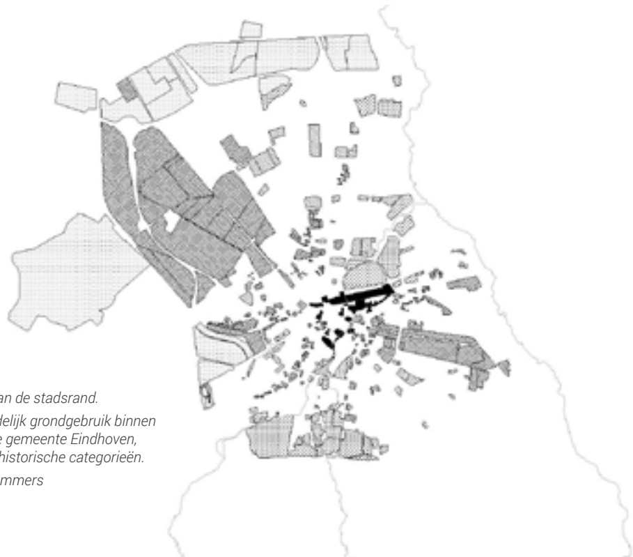
Evolutie van de vorm van de stadsrand. Representatie van extensief stedelijk grondgebruik binnen de actuele plattegrond van de gemeente Eindhoven, weergegeven in morfologisch-historische categorieën.