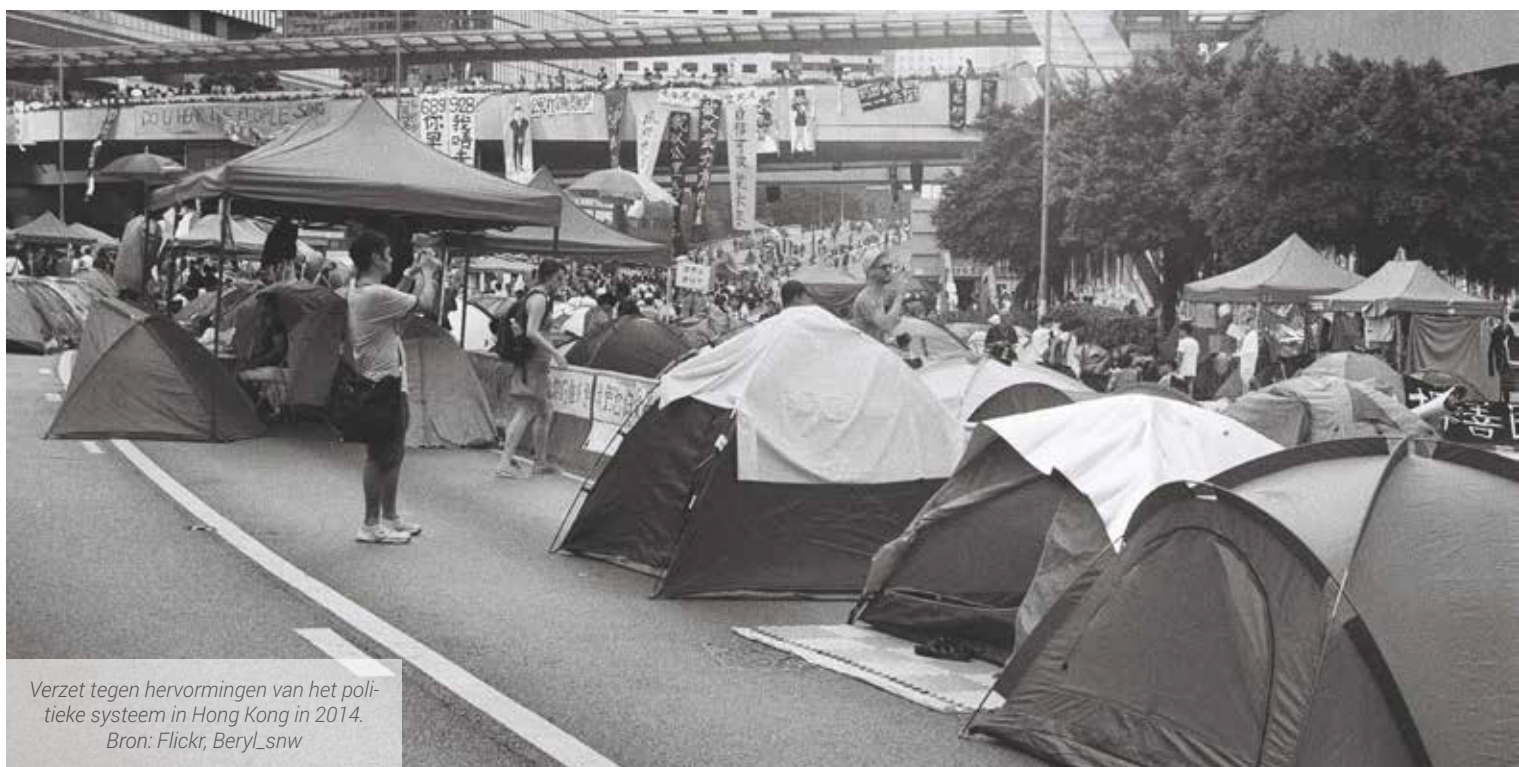
Verzet tegen hervormingen van het politieke systeem in Hong Kong in 2014.

Maar, zoals hierboven beschreven, lijkt de scope voor grootschalig verzet in de 21e eeuw vernauwd. Dit betekent echter niet dat verzet – tegen de markt, ongelijkheid en onrecht – verdwenen is. In plaats daarvan heeft verzet veelal andere vormen aangenomen. Over de hele wereld zien we dat kleinschalige grassroots bewegingen wel duidelijk aanwezig zijn, en in staat zijn verzet teweeg te brengen. In veel gevallen richten deze vormen van verzet nog steeds op het bieden van tegenwicht aan neoliberalisering, en bevragen zij structurele ongelijkheden. Maar deze vormen van verzet ontstaan niet alleen uit sociaaleconomische tegenstellingen, maar borrelen juist op langs andere, groeiende breuklijnen in de samenleving. Het gaat hier om gemarginaliseerde groepen die niet of nauwelijks gehoord worden, en via verzet hun plek claimen en hun belangen op de kaart zetten. En dit zijn diverse groepen, van wie je niet direct zou verwachten dat ze zich mobiliseren om in verzet te komen. Deze groepen richten hun verzet doorgaans op onderwerpen op een relatief laag schaalniveau die hen direct raakt. Het gaat dan om concrete en behapbare thema's, zoals vaak het geval is bij sociale bewegingen. Maar deze thema's zijn wel ingebed in bredere en globalere kwesties met betrekking tot structurele ongelijkheden en misstanden. Veel grassroots bewegingen slagen er niet in om hun verzet naar een hoger schaalniveau te brengen en blijven sterk gefocust op het nabije en concrete, andere bewegingen