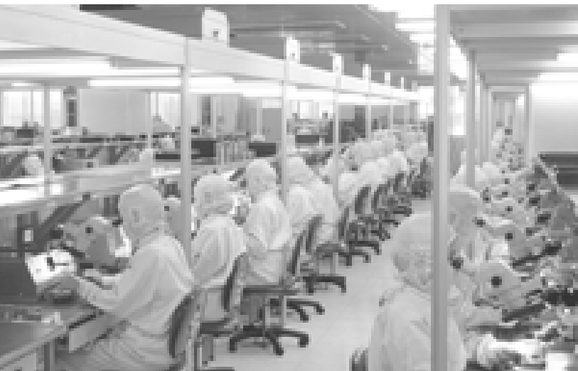
Foto: Arbeiders in Shenzhen assembleren glasvezel systemen

Als we praten over China's geopolitieke positie is het volgens Yunpeng cruciaal om in rekening te brengen wat er binnen China gebeurt. Toen China zich positioneerde als de 'fabriek van de wereld', ging het vooral om een op export gerichte economie. De financiële crisis van 2008 en de daling van de export die ermee gepaard ging, zorgde voor massale werkloosheid. Om de economie in evenwicht te brengen en de werkloosheid aan te pakken, beloofde de overheid grootse infrastructuurprojecten.