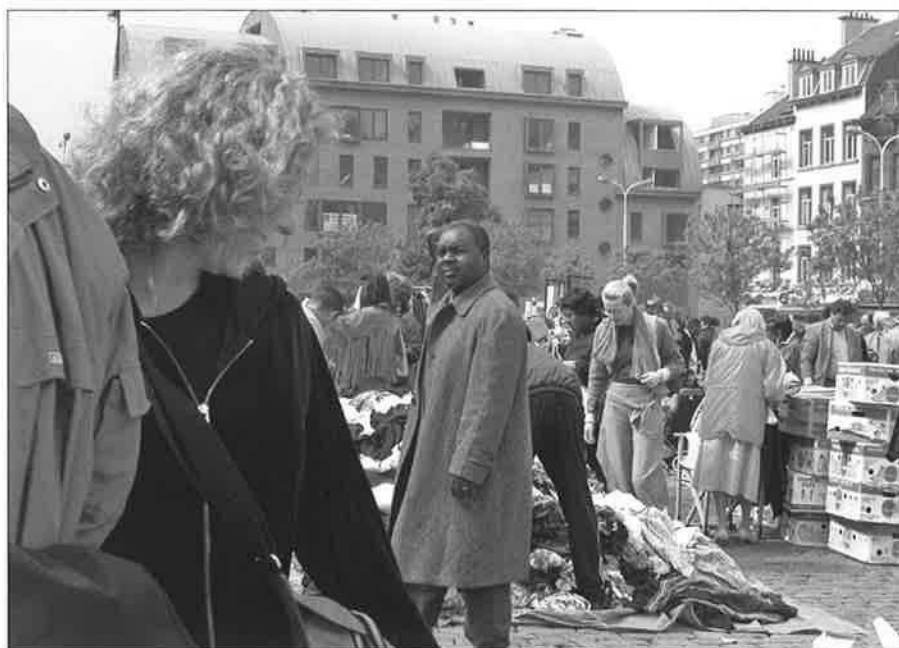
Op de rommelmarkt van het Vosseplein mengen hippe snuisteraars zich met dakloze koopjesjagers.

Solidariteit kan volgens Van Oorschot gedefinieerd worden als een (graad van) binding tussen individuen en groepen van een gemeenschap die het mogelijk maakt dat collectieve belangen behartigd worden. Solidariteit is in een bredere maatschappelijke context te situeren, maar komt tot stand door intermenselijke relaties. Solidariteit is dus als een complex en meerschallig maatschappelijk fenomeen te benaderen, dat zich enkel laat bestuderen als levende en geleefde realiteit, optredend op microniveau maar vol reflecties van invloeden van hogere orden. Twee maatschappelijke trends hebben solidariteitspraktijken recentelijk sterk beïnvloed en zelfs grondig hervormd. Ten eerste de overgang van een Fordistisch naar een post-Fordistisch samenlevingsmodel. Dit is een overgang van een model gebaseerd op productiviteit en collectieve voorzieningen waarin de staat de voornaamste actor is, naar een model waarin handel, diensten en kennis centraal staan en waarin welvaart en welvaartsverdeling geïndividualiseerd zijn. De staat is niet langer de centrale