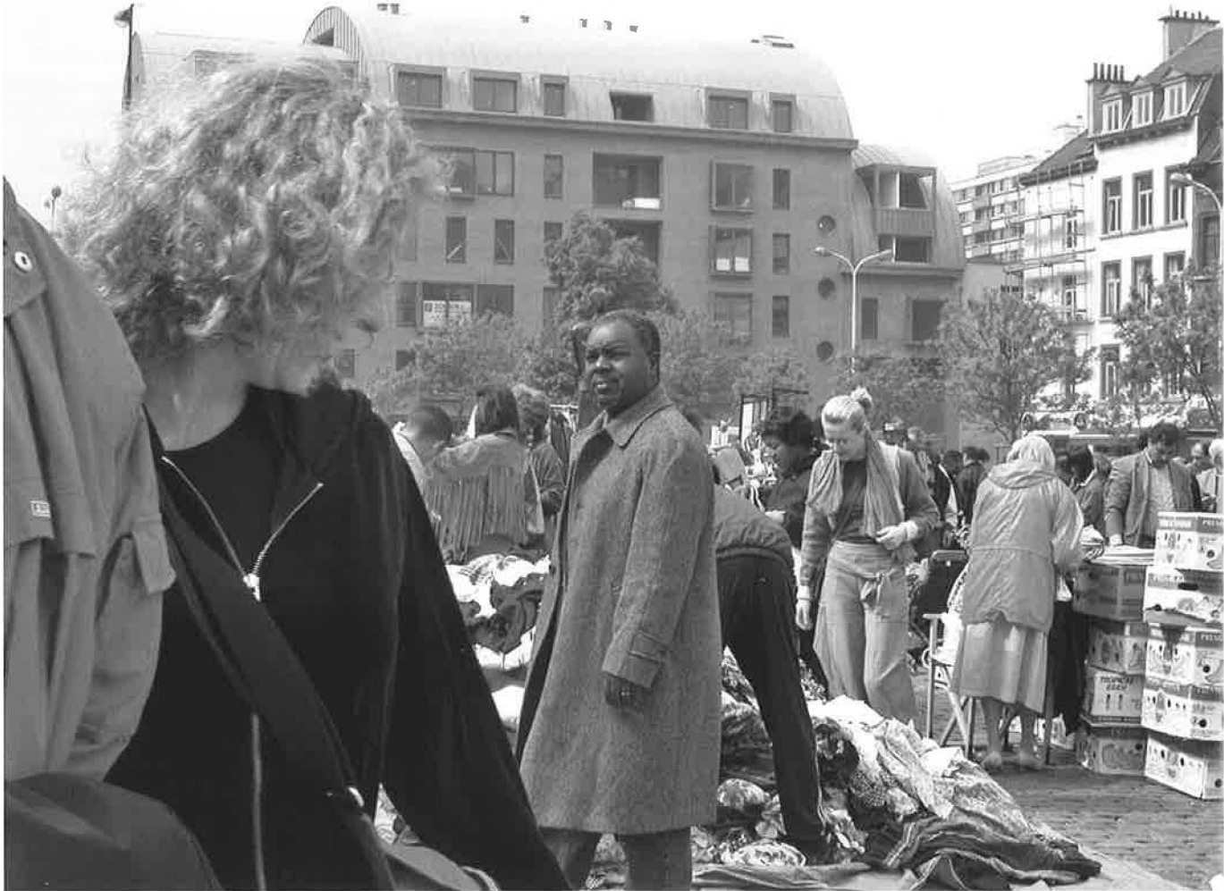
Op de rommelmarkt van het Vosseplein mengen hippe snuisteraars zich met dakloze koopjesjagers.