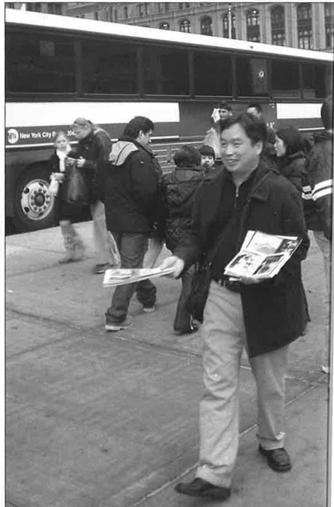
Touringcars en straatverkopers