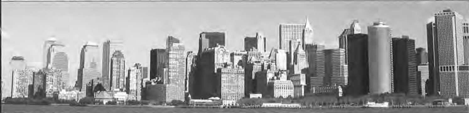
Lower Manhattan na 9/11

verzamenen onder oudgedienden en nieuwkomers, alleenstaanden en getrouwde stellen met kinderen, mannen en vrouwen, huurders en copers, als ook onder bewoners en gemeenschapsleiders. Door met verschillende soorten bewoners te praten waren we in staat de vele ontstane conflicten en opinies te identificeren. Op basis van de interviews met bewoners en gemeenschapsleiders en participerende observaties onderscheiden wij drie typen van verandering die in Battery Park City optreden.