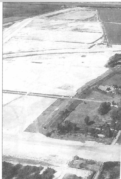
Ruigoord 1999, de natuur rond het dorp is afgegraven.

Ruigoord staat in de regio, maar ook internationaal, bekend als kunstenaarsgemeenschap. In de kerk en op de vlakte naast het dorp hebben vele activiteiten plaatsgevonden, waaronder het jaarlijkse festival Landjuweel, de Vollemaansfeesten, dichtersfestivals, tentoonstellingen en andere evenementen zoals de bouw van de millenniumtoren. Unieke cultuur werd hierbij gecombineerd met unieke natuur. De laatste kon ontstaan doordat in de jaren zestig de omgeving van