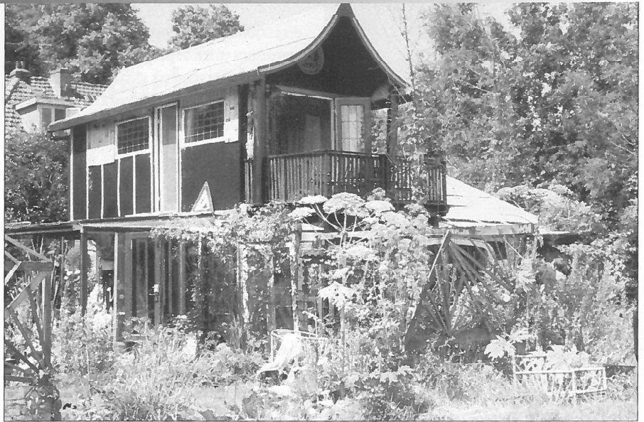
Wonen in Ruigoord.

Door de lichte vorm van bouwen en de grote kavels kan snel worden ingespeeld op veranderende woonwensen. Het is vaak voorgekomen dat bij een echtscheiding een kavel in tweeën is gedeeld zodat beide ouders een eigen huisje kunnen bouwen en toch gezamenlijk voor de kinderen kunnen zorgen. De grootste gemene deler in Ruigoord