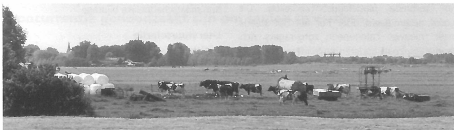
De traditionele landbouw heeft het moeilijk.

Op agrarische bedrijven ontstaat steeds meer ruimte voor het ondernemen van niet-agrarische activiteiten, al dan niet in combinatie met het boerenbedrijf. Streekproducten, kamperen bij de boer, natuurproductie, het zijn allemaal mogelijkheden die boeren hebben om nieuwe inkomsten te creëren. Omdat sommige segmenten van de landbouw in een crisis verkeren, maken boeren gebruik van dergelijke alternatieven om hun inkomen op peil te houden. Deze ontwikkeling wordt aangeduid als 'verbrede plattelandsontwikkeling'. Een vorm hiervan die in opkomst is, is zorglandbouw: de combinatie van landbouw en zorg.