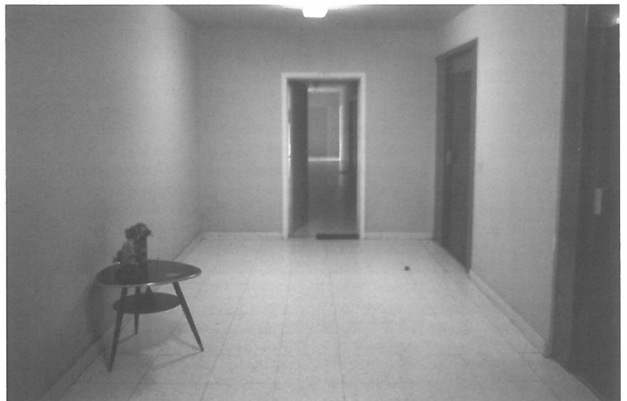
Nieuw-Sledderlo: persoonlijke invulling van een lifthal.

Eerst en vooral moeten de partners elkaar kunnen kiezen: ze moeten elkaar tegemoet kunnen treden of elkaar kunnen negeren. Daarnaast moeten ze de ruimte op elk moment