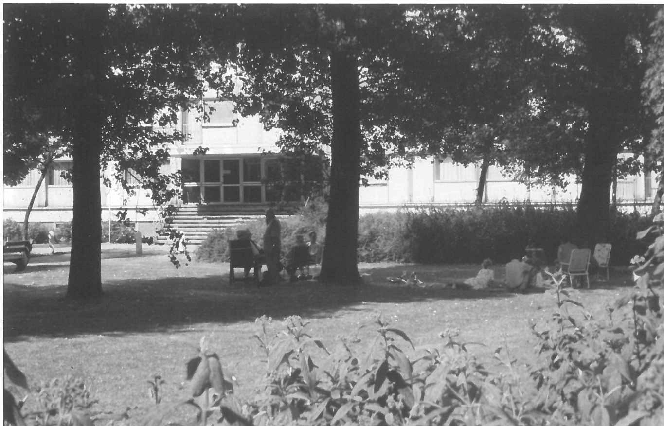
Rabot: ontmoetingsplaats onder de bomen