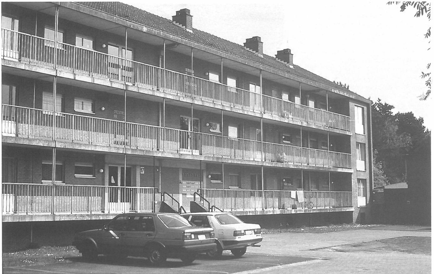
Nieuw-Sledderlo: appartementen met galerijen vooraan

mede bepalend voor 'de herkenning' van archetypische ruimtes. De stedenbouwkundige opbouw van de wijk Nieuw-Sledderlo, met open ruimtes en een variatie in straataanleg, groenstructuren en woningen, wordt sterk gewaardeerd door de bewoners met een mediterrane culturele achtergrond. Het typische buitenleven is goed mogelijk in deze wijk. In het Rabot vinden we restanten van een traditionele cultuur in het ruimtegebruik van de Vlaamse ouderen: het tevoorschijn halen van strandstoelen om in de schaduw van de bomen een zomermiddag weg te babbelen, het bijeenzitten onder de luifel, het voor het raam zitten en naar buiten kijken.