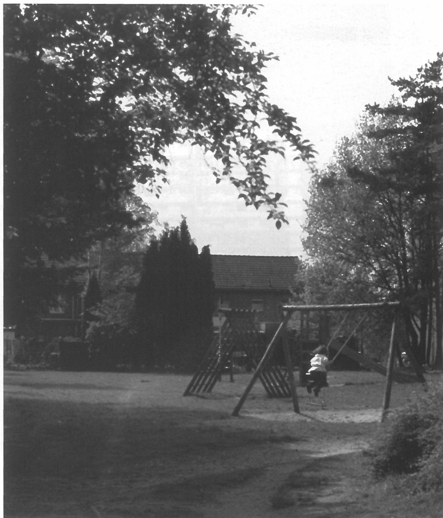
Nieuw-Sledderlo: groene openbare ruimte tussen de woningen

Een derde aspect dat belangrijk is voor de mogelijkheid tot ontmoeting is flexibiliteit: de ruimte kan op een 'meervoudige' manier gebruikt worden. Flexibiliteit staat vooral voor de mogelijkheden die de bewoners hebben tot amendering of toeëigening van de ruimte. Dit betekent dat het geplande of voorziene gebruik niet 'uitsluitend' is. Flexibele ruimtes kunnen wijzigingen ondergaan in statuut, functie of uitgebreidheid. Wederkerige relaties en strategieën kunnen zich het best ontplooiën in de 'tussenzones', de semi-publieke ruimtes, waarvan de codering het minst vastligt. Formele ontmoetingsplaatsen, die als ontmoetingsruimte zijn ontworpen of bedoeld,