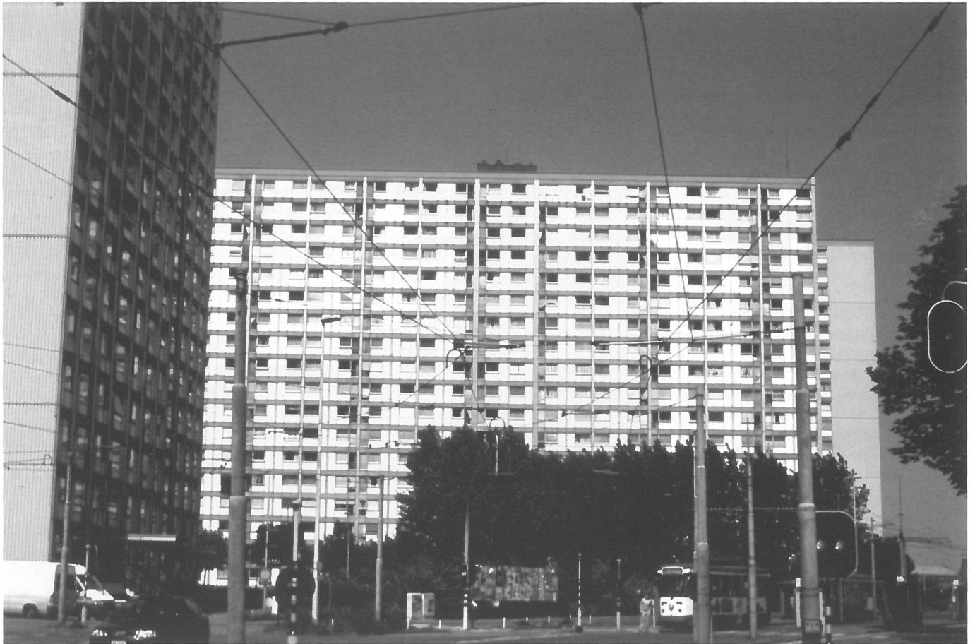
Rabot: Zicht op de drie woontorens

wat over de wijk wordt gezegd. Ze kunnen de denkbeelden niet nuanceren. Een nieuwe bewoonster van Nieuw-Sledderlo zag overal tekenen van het negatieve dat men haar had verteld. Fysieke ervaring met de wijk ('men is er geboren en getogen' versus 'men woont er pas') en met het type woning ('we hebben altijd in appartementen gewoond' versus 'we zijn anders gewend') speelt een grote rol. Res-