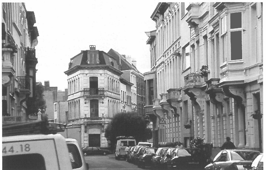
De dichtbebouwde wijk Oud-Borgerhout

een bijna paranoïde controle van de vrouwen. Maar Bourdieu benadrukt dat de vrouw ook in westerse maatschappijen verantwoordelijk is voor het sociale kapitaal van de familie. Zij staat immers in voor het in stand houden van de sociale relaties, door kaartjes te sturen en mensen regelmatig uit te nodigen, voor de gezellige inrichting van het huis en het uiterlijk en de kleding van de familie. En aangezien dit allemaal onbetaalde werkzaamheden zijn, worden zij als inferieur beschouwd ten opzichte van werkzaamheden