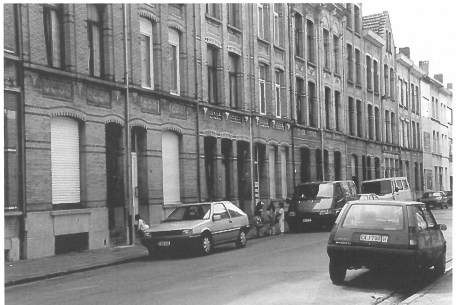
Straatbeeld in Oud-Borgerhout

Bourdieu, P. (1998) La domination masculine . Saint-Amand-Montrond: Editions du Seuil.