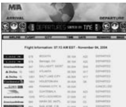
Miami International Airport is een knooppunt in het transportnetwerk tussen de VS en Latijns-Amerika.

Voor de grootste nationale banken in Centraal-Amerikaanse landen is Miami veruit de belangrijkste stad in de wereld